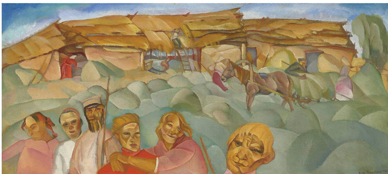
Борис Григорьев "Расея", 1920

Auteur: Елена Курбацкая, Лондон , 13.11.2014.