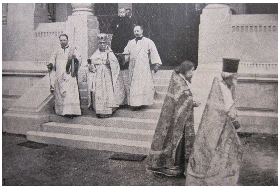
Освящение храма и колокольни в Женеве, февраль 1917 г. La Patrie suisse. №613,