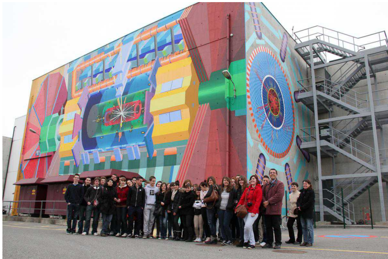
Ученики лицея им. Эйнштейна из Баньоль-сюр-Сез (Франция) в ЦЕРНе

Больше информации на эту тему вы найдете в нашем специальном досье .