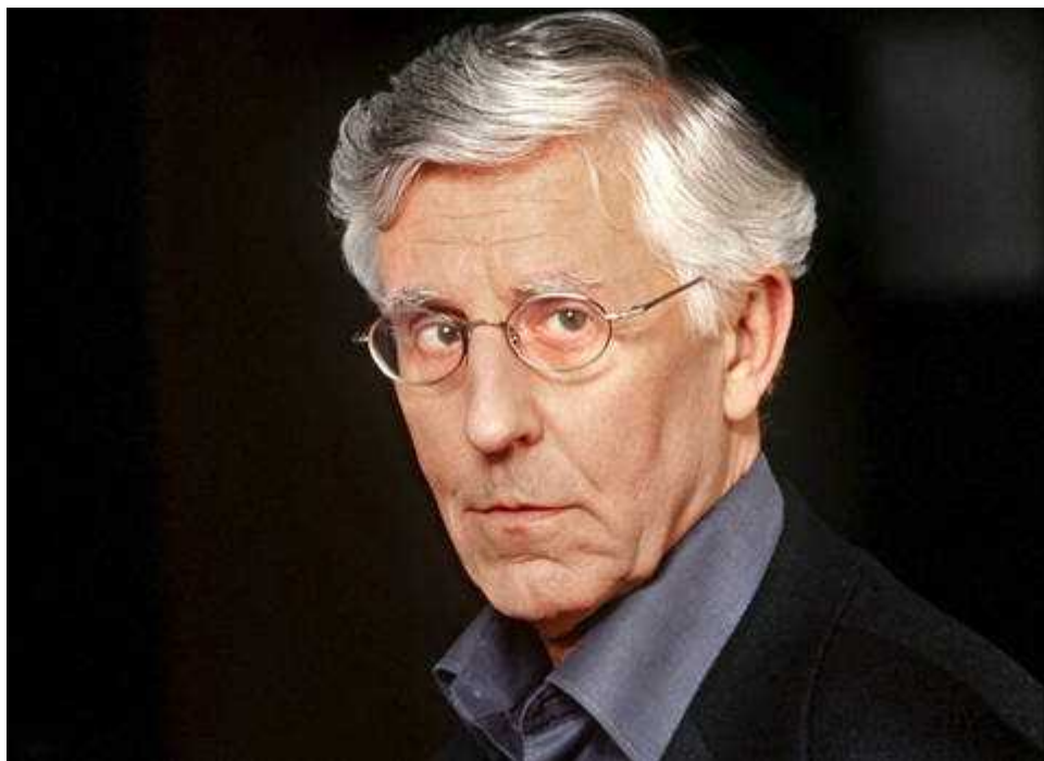
Петер фон Матт - лауреат премии Братьев Гримм

Auteur: Сноб-НГ, Женева - Москва , 28.11.2013.