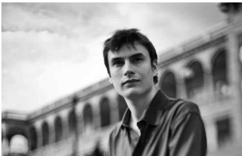
Писатель Сергей Шаргунов