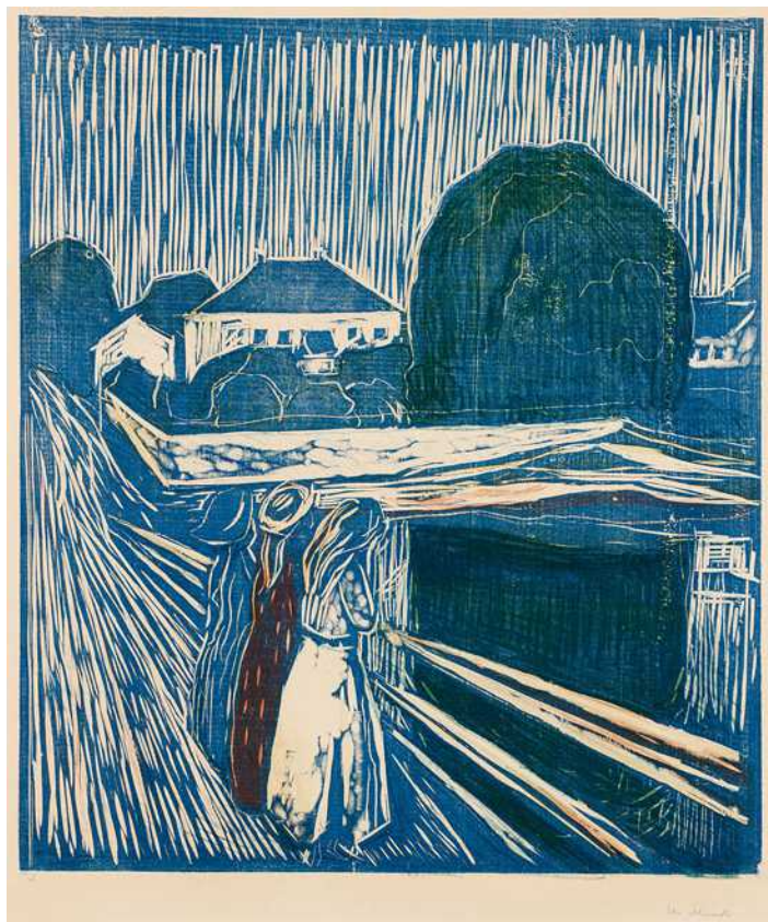
Девушки на мосту. Эдвард Мунк. 1918 год

Мунк не был первым или единственным, кто это почувствовал, но он стал одним из немногих, кто сумел это выразить. К сожалению, его предостережение не было услышано вовремя. И теперь, когда мы можем оглянуться на прошедшее столетие, становится очевидным, каких бед можно было избежать, научись люди слушать друг друга. А пока получается как по Маяковскому: