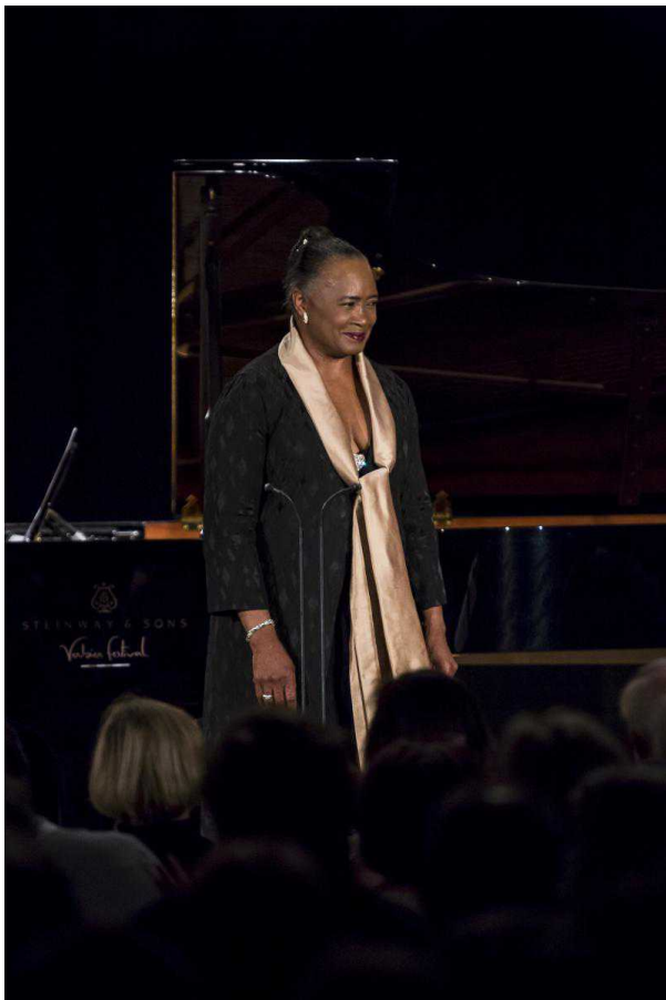
Барбара Хендрикс

Во втором отделении этой невероятной программы публика сможет восхититься мастерством великолепного уэльского баса-баритона Брина Терфеля (Ватон), в последние годы ставшего постоянным участником Фестиваля. Валерию Гергиеву, наверно, скучно было путешествовать в одиночку, поэтому он прихватил с собой восемь солисток Мариинского театра в качестве Валькирий. «Полетом валькирий», сестер предавшей Вотана Брунгильды (шведская сопрано Ирен Теорин), и открывается третье действие оперы. Эта музыка известна всем, ведь именно она звучит в фильме Копполы «Апокалипсис сегодня», получившем в 1979 году в Каннах Золотую пальмовую ветвь. С Георгиевым приехала и съемочная группа, которая запечатлеет все это великолепие. Так что если Вы не сможете побывать в Вербье сегодня, есть шанс увидеть запись позже. Но это, конечно, не то же самое.