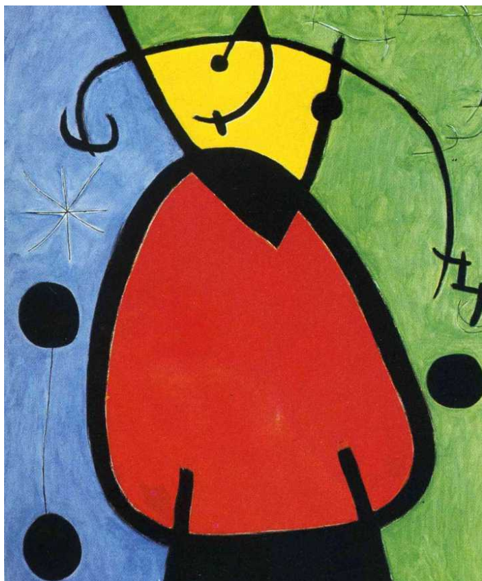
Рождение дня. Жоан Миро. 1968 год

динамично выведенными рукой мастера. И тогда каждая линия, каждое сочетание цветов наполняется значением, рассказывая зрителю историю духовных переживаний.