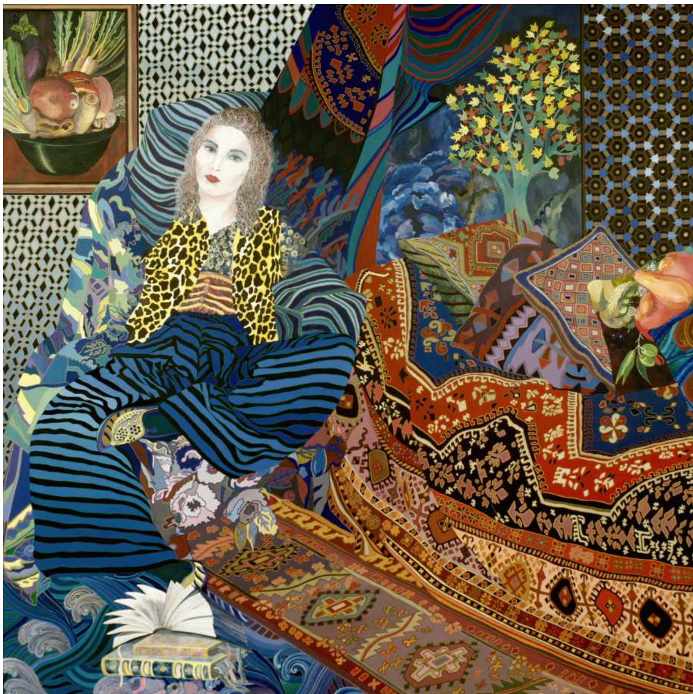
Шахерезада (© Artvera's)

В женевской галерее Artvera's открылась выставка-продажа картин художницы, которая смело использует декоративные элементы и сводит вместе самые разные персонажи.