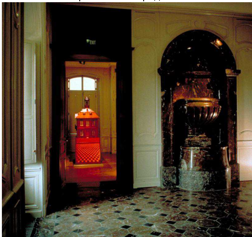
Мраморный зал

Барон Луи-Франсуа Гиге прожил короткую жизнь – всего 45 лет... Но эта короткая жизнь была согрета теплом родного