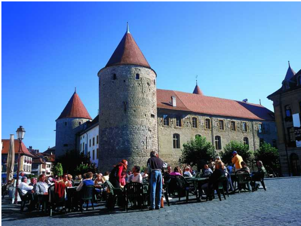
Замок в Ивердон-ле-Бен (yverdonlesbainsregion.ch) история Швейцарии издательское дело в Швейцарии

Source URL: http://nashagazeta.ch/node/14469