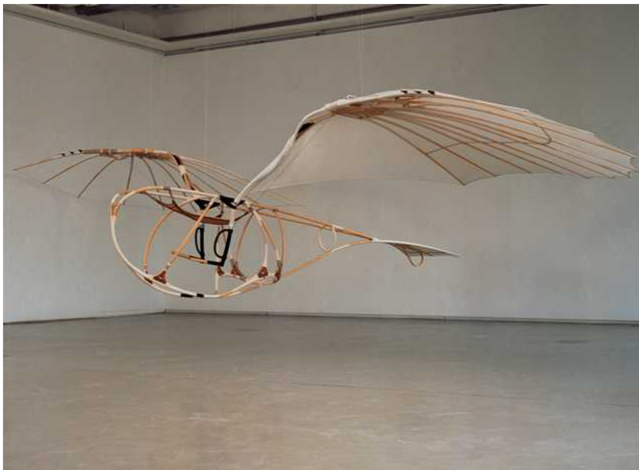
«Летатлин», 1929-1932.