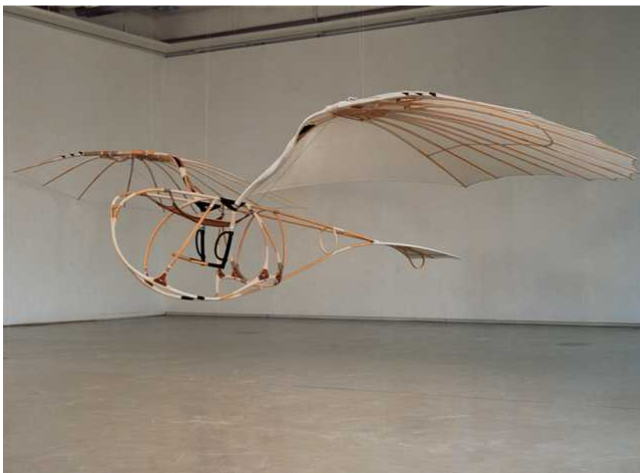
«Летатлин», 1929-1932.