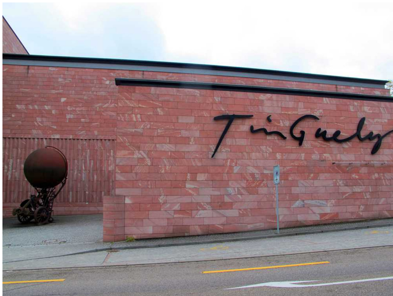
Музей Жана Тенгли в Базеле

Стоимость билетов: Взрослые: CHF 15 Школьники и студенты: CHF 10 Дети до 16 лет в сопровождении одного взрослого: бесплатно. Тех, кто еще не решил, стоит ли ехать, приглашаем посетить нашу фотогалерею .