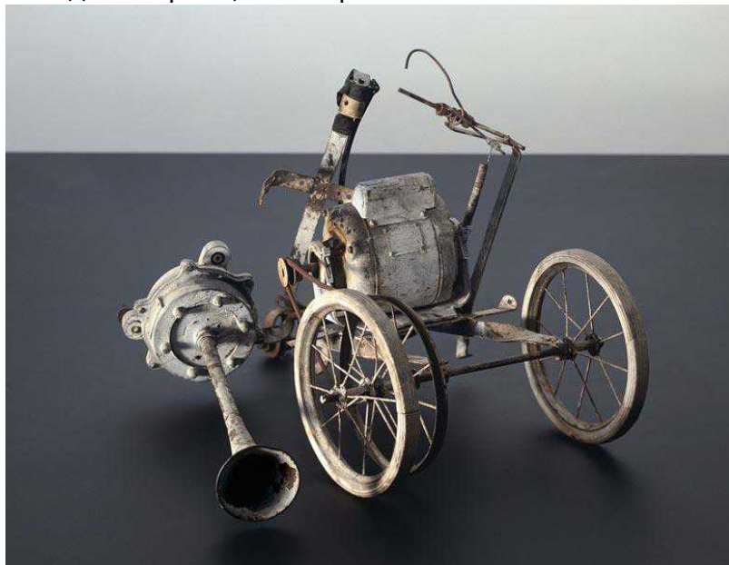
Ретроспектива творений Жана Тангли в Музее его имени

В течение всей Ночи, начиная с 17 часов, по всей сети музейных маршрутов будет организовано бесплатное движение транспорта, которым можно пользоваться, предъявив свой билет на Ночь музеев. Транспорт будет на любой вкус: трамваи, перевозки через Рейн и автобусы со специальными дополнительными рейсами, которые будут привозить, а потом доставлять в поздний час домой гостей из соседних Франции и Германии.