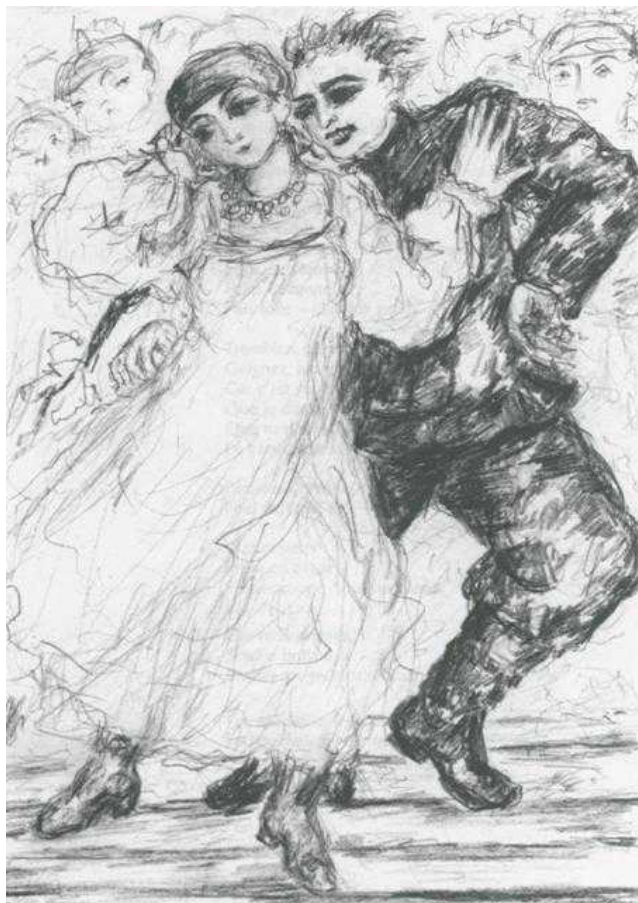
Рисунок Натальи Гончаровой к стихотворению Марины Цветаевой "Молодец" Что же касается содержащихся в «Красной тетради» писем, часть из которых написаны адресатам, забытым самим автором, то это настоящая груда черновиков, как бы словесных "инсталляций". Работа всей жизни над собой, пишет она, состоит в стремлении поймать первую, спонтанную, мгновенную форму... Эта «игра в догонялки», возможно, действительно, является первой движущей силой ее поэзии, ее прозы, ее жизни; и если «Красная тетрадь» позволит лучше это почувствовать, то ее запоздалая публикация оправдана.