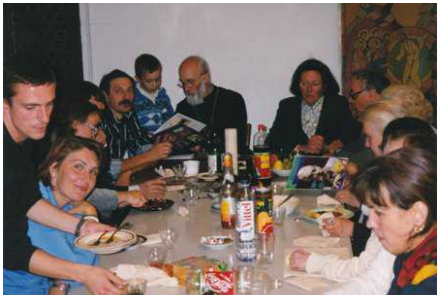
Общая трапеза после праздника (Базельский приход, 2000 год)