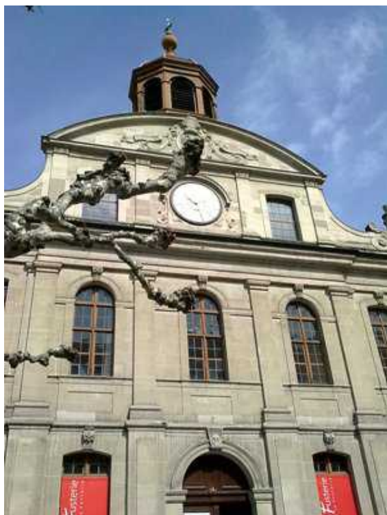
Барочный фасад храма

из беженцев попытались найти пристанище в регионе Во, но вернулись в Женеву за неимением лучшего». О новоприбывших следовало позаботиться: предоставить им кров, пропитание и духовное утешение. Теперь в женевских храмах стало совсем тесно, назрела необходимость срочно возводить новые.