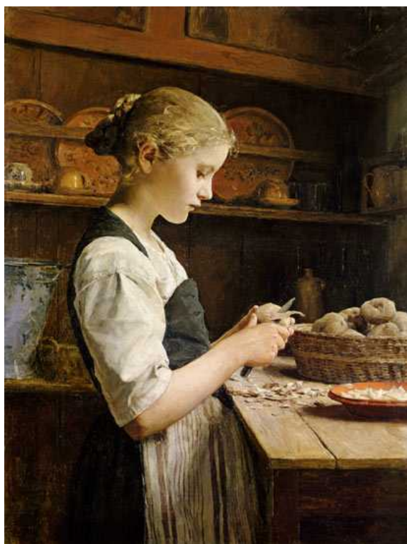
"Маленькая чистильщица картошко", 1886 г.

В 1866 году Альберт Анкер начал заниматься росписью фаянса для Теодора Дека, знаменитого французского фабриканта фаянса 19 века. За последующие годы появилось более 300 рисунков для фаянса Анкера. Он работал также в качестве иллюстратора для швейцарских художественных журналов.