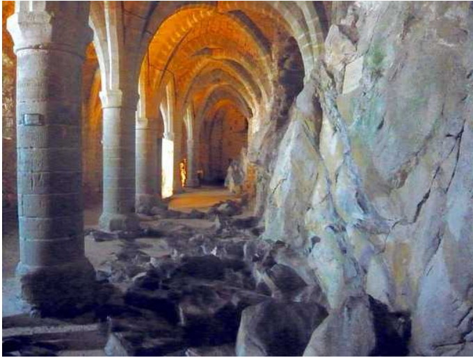
Тюремная галерея Шильонского замка