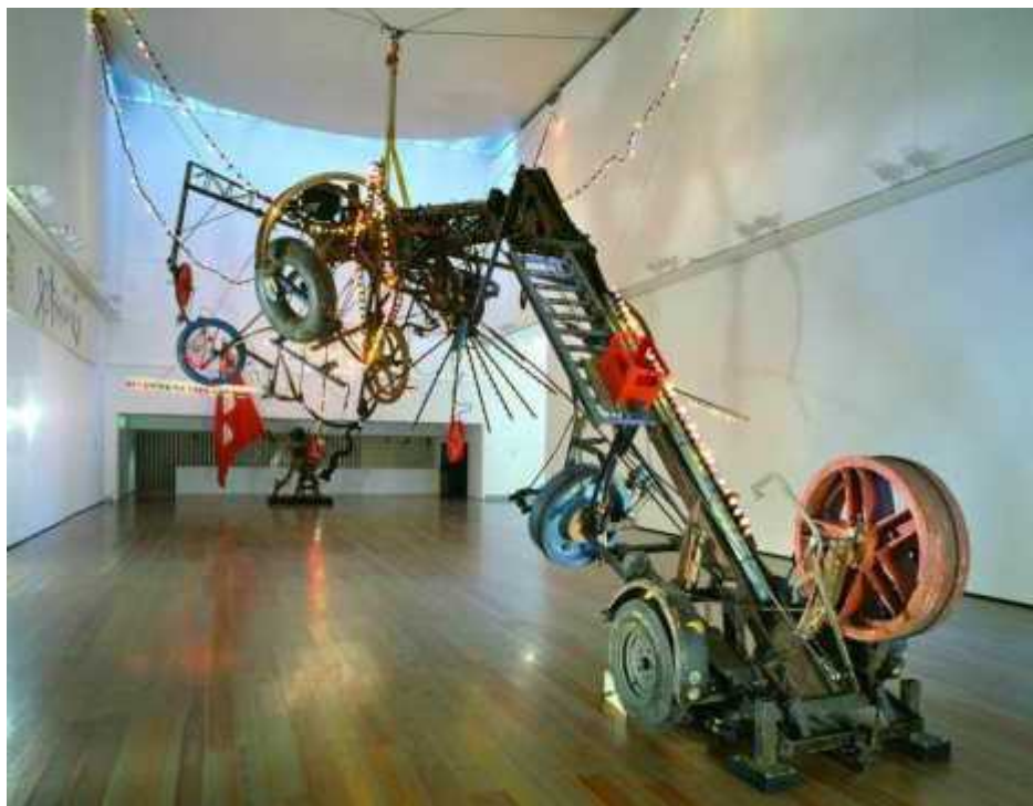
Жан Тэнгли, Luminator, 1991 (tinguely.ch)

Auteur: Ольга Юркина, Базель/Фрибург , 16.09.2011.