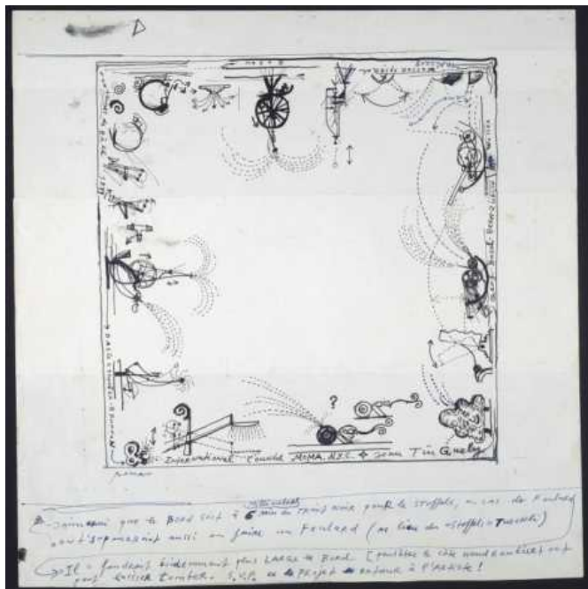
Эскиз к "Карнавальному фонтану" в Базеле, 1977 (tinguely.ch)

Тем не менее, яркая струя уравнивала страхи в подсознании и воображении молодого художника: Базельский карнавал, каждую весну наводнявший улицы города бесконечным потоком красок, затейливых атрибутов и причудливых фольклорных существ. У карнавального гулянья Тэнгли научился смелой провокации, едкой насмешке и беспечному юмору – качествам, которыми он наделит все свои механические создания. Уже будучи известным скульптором, в 80-х годах он снова вольется в карнавальную стихию и будет лично руководить группой ряженных на улицах родного города – «Промывателями требухи».