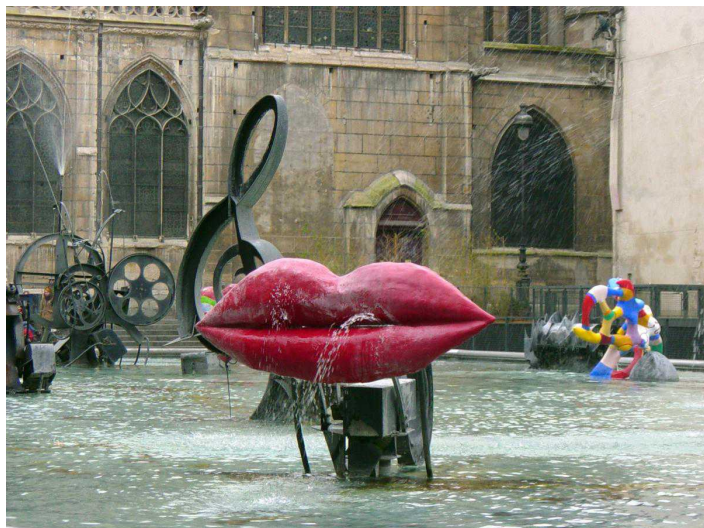
Фонтан "Стравинского" в Париже, Жан Тэнгли и Ники Сен-Фалль, 1983

Что общего между Парижем, Базелем и швейцарским Фрибургом? Прогуливаясь по каждому из этих городов, столь непохожих друг на друга, любопытный наблюдатель заметит причудливые фонтаны, приводимые в движение неуправляемыми, словно вышедшими из-под контроля механизмами. Но приглядевшись к хаотично вращающимся колесикам, разбрызгивающим струи воды на радость сбегающим детям, можно увидеть моторчики и тросы, выставленные на всеобщее обозрение. Наивные и трогательные, насмешливые и провокационные, механические скульптуры не перестают удивлять, вызывая одобрение, восторг или улыбку.