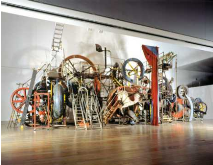
"Большая Мета Макси-Макси Утопия", мета-гармония, 1987

Новый виток творческий путь скульптора делает в 1963 году, когда Тэнгли окрашивает свои произведения в черный цвет, подчеркивая их структуру, и начинает использовать шарикоподшипники, экспериментируя с комбинацией балансирующих и вращательных движений. Новая техника позволит ему расширить «кругозор» создаваемых механизмов. Постепенно Тэнгли реализует свою идею мультисенсорной скульптуры – двигающейся, шумящей, пахнущей, затрагивающей разом все органы чувств наблюдателя.