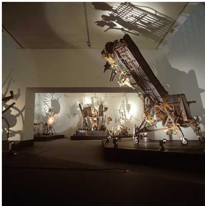
"Менгеле - танец смерти", 1986

Однако, несмотря на радостную струю, с ярким универсумом «мета-гармоний» и музыкальных фонтанов соседствуют темные мысли и образы. Тема мимолетности и смерти все чаще пробивается сквозь цветной причудливый мир. Одним из самых впечатляющих произведений Тэнгли станет «Менгеле – танец смерти». Созданная в 1986 году из остатков сгоревшей фермы, конструкция представляет собой авангардистскую вариацию на знаменитый средневековый сюжет о бренности бытия, представленный, в частности, на исчезнувшей настенной живописи в Клингентальском монастыре Базеля.