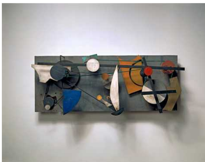
"Чудо-машина Мета-Кандинский I", полихромный рельеф, 1956