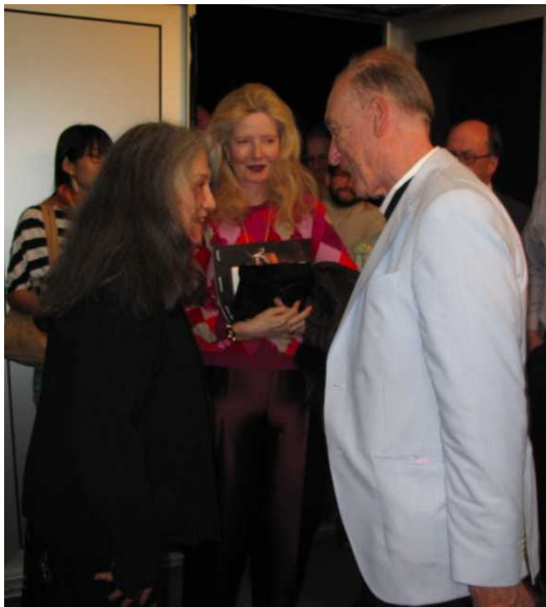
Родион Щедрин и Марта Аргерих

Я бы слово «современная» применительно к музыке вообще не использовал. Есть просто музыка – плохая или хорошая – и живущие в наше время композиторы. Вот ведь известно, что Марта Аргерих никогда не играет «современную» музыку – но согласилась исполнить мой концерт, написанный в 2010 году.