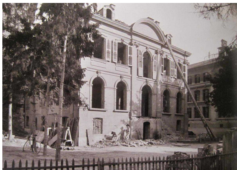
Демонтаж дома в О-Бив, 1907 г. Из книги Christine Amsler. Maisons de campagne genevoises du XVIIIe siècle . Tome II. Genève, 2001

Наряду со взрослыми, которые сознательно исповедовали Православную веру и желали бы открытия храма, на леманском побережье в пансионах и частных институтах воспитывалась русская и греческая молодежь, нуждавшаяся в самом первоначальном наставлении о вере и противодействии инославному влиянию. В пансионе в квартале Шампель в 1850 году находилось 12 молодых греков с острова Корфу, а в разных женевских и водуазских пансионах — несколько русских молодых девиц.