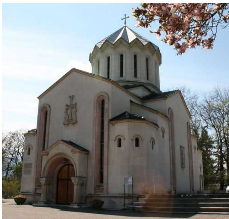
Армянская церковь в женевском квартале Труане

В Швейцарии, где живет значительное число выходцев из Армении, как мы уже