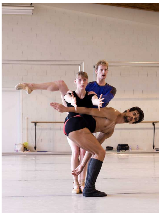
Фрагмент хореографии "Элтон Берг"

Первая из них, «Кантик», навеяна древними текстами Каббалы, поставлена на традиционную еврейскую музыку и впервые была представлена в декабре 1987 года в Иерусалиме. Как говорил сам Морис Бежар «Это па де де в каком-то смысле – макет (но не отрывок и не дайджест) балета «Дибук». Исполнители – Элизабет Рос и Жиль Роман.