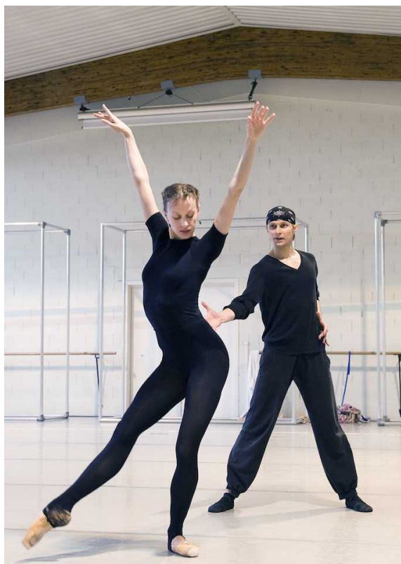
Фрагмент хореографии "Мефисто-вальс"

А 5 и 6 июня там же, в Театре Болье, пройдут гала-концерты труппы