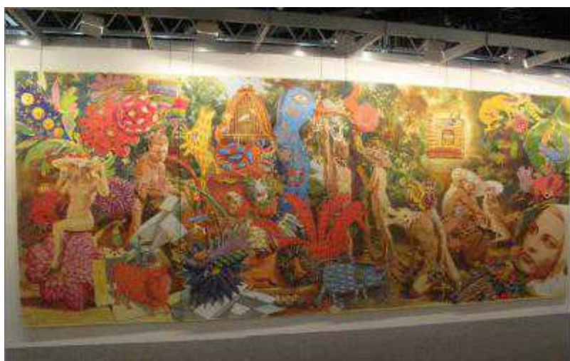
Арсен Садатов "Райский сад"

Author: Надежда Сикорская, Женева , 29.04.2010.