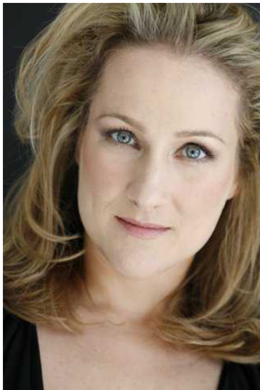
Диана Дамрау