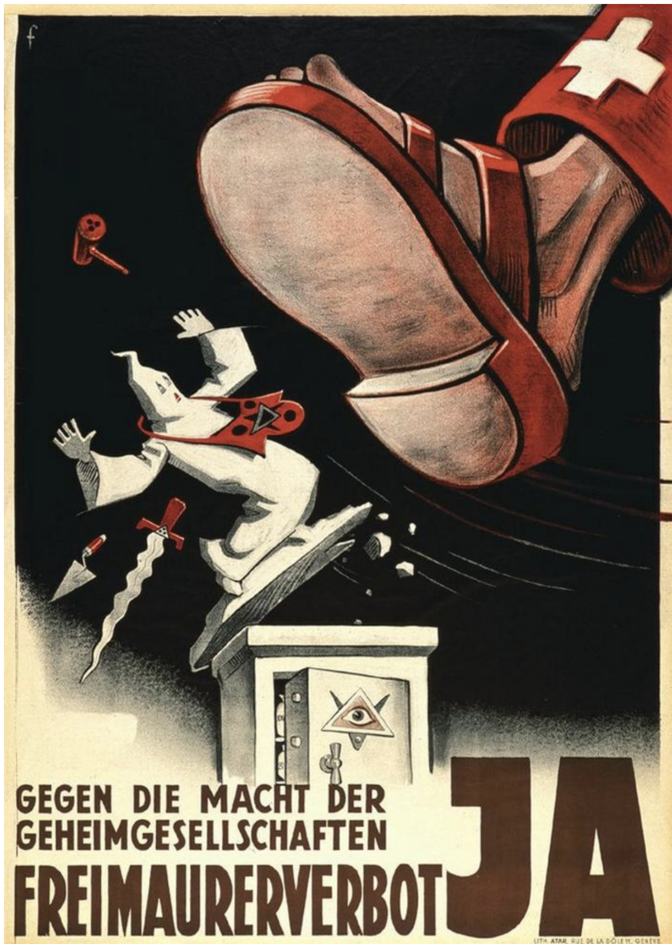
Плакат Национального фронта: «Сын Телля! Восстань против масонской тирании: да». Автор - Ноэль Фонтане