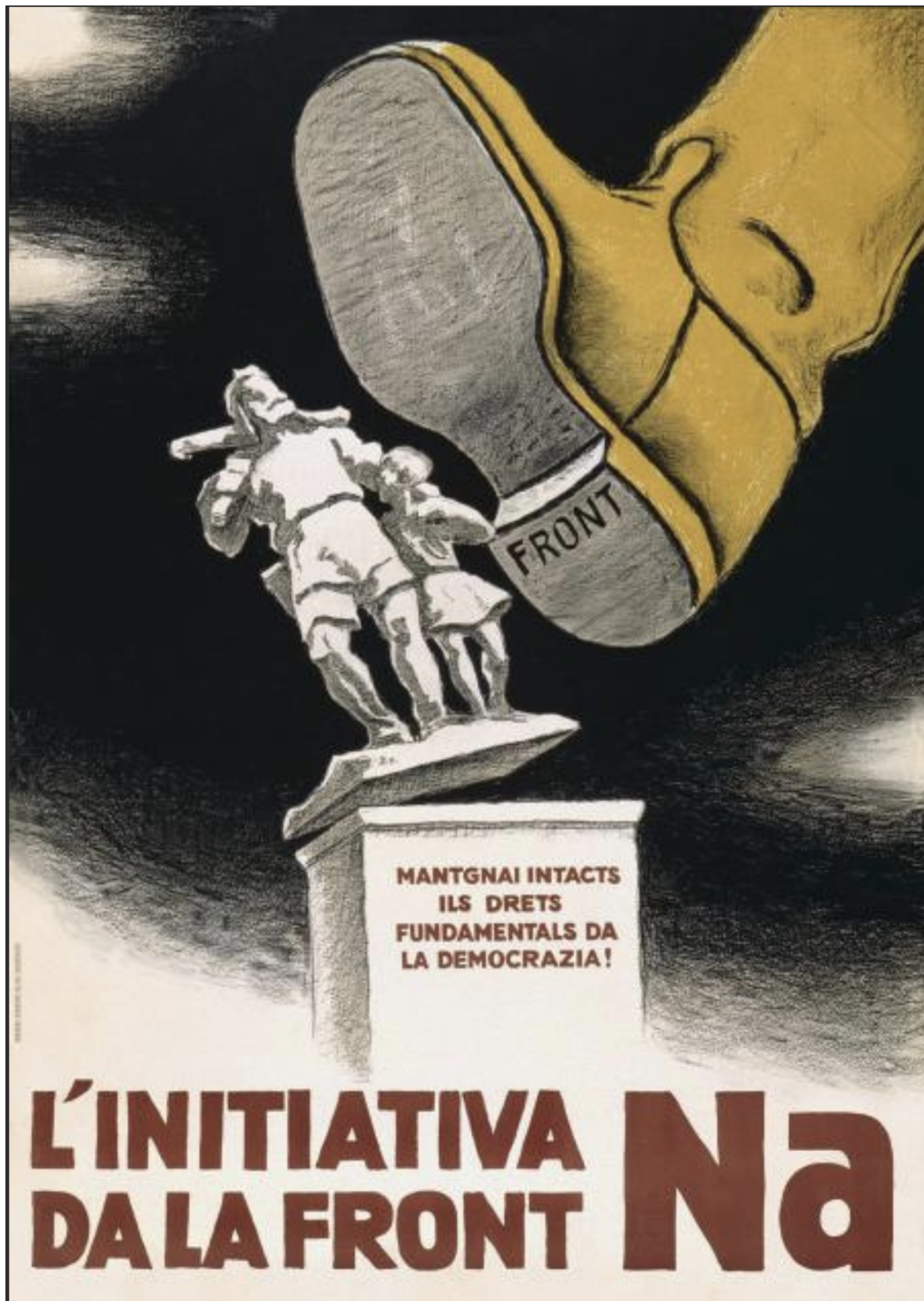
На цокле памятника Вильгельму Теллю, который сталкивает ботинок фронтистов, надпись на ретороманском языке: «Сохраним нетронутыми фундаментальные права