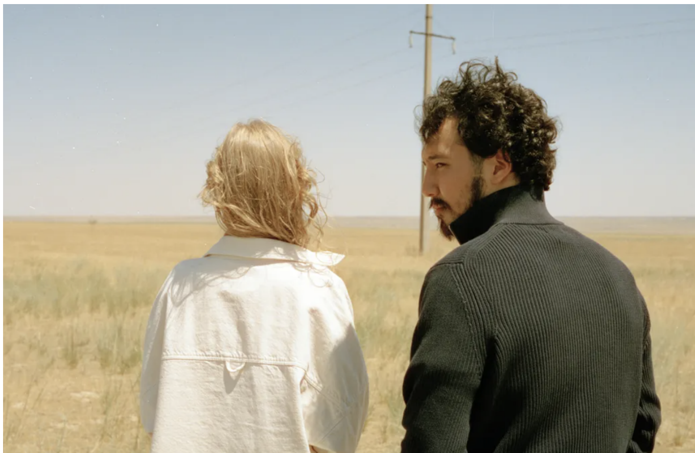
Кадр из фильма «Joqtau»