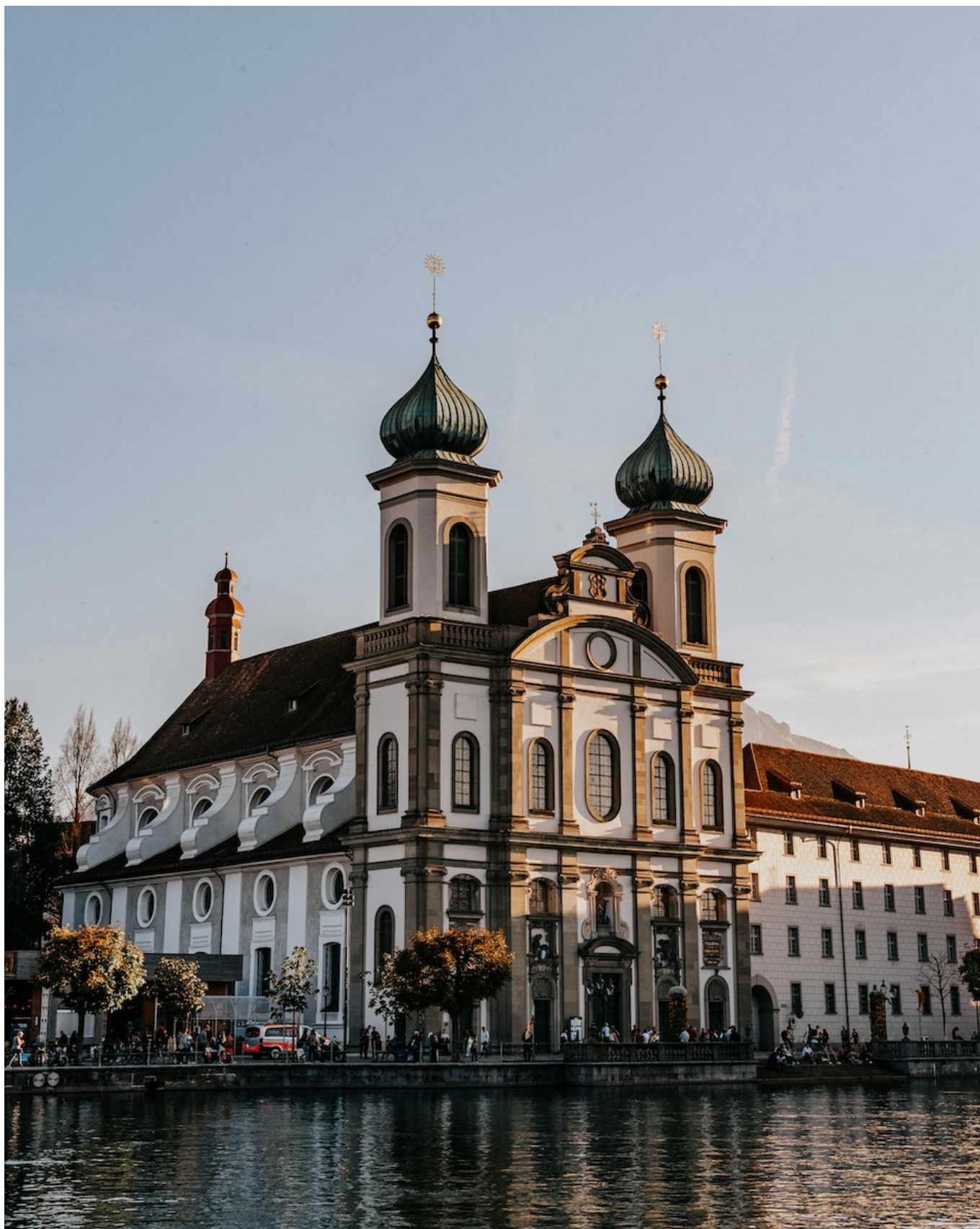
Сферы на луковичных куполах Иезуитской церкви в Люцерне.

Сферы обычно открывают только тогда, когда шпиль нуждается в ремонте, что, безусловно, не облегчает работу исследователей. Что же находят историки внутри капсул? Почти всегда там находится документ с датой и сведениями о приходе, а иногда и с указанием причины, по которой сфера уже была однажды открыта,