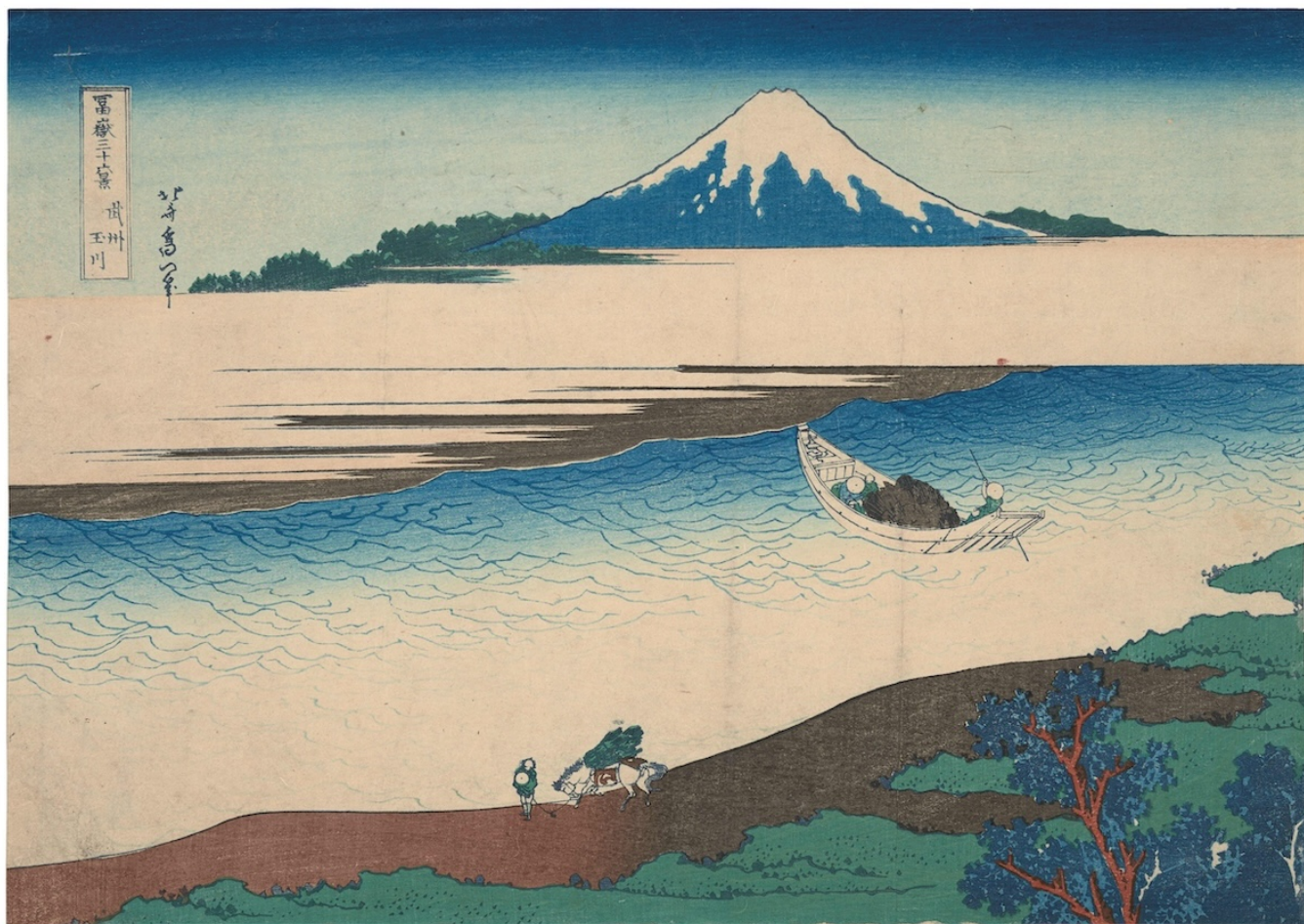
Река Тама (Тамагава) в провинции Мусаси. Из серии: 36 видов горы Фудзи. Кацусика Хokusай, 1831. Kunstmuseum Basel.

доступны лишь в нескольких экземплярах, а то и в одном. Портреты Тосусая Сяраку, например, сейчас чрезвычайно редки. Рекомендуем всем, кто неравнодушен к японской культуре.