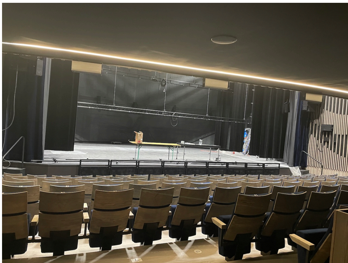
Становится похоже на концертный зал