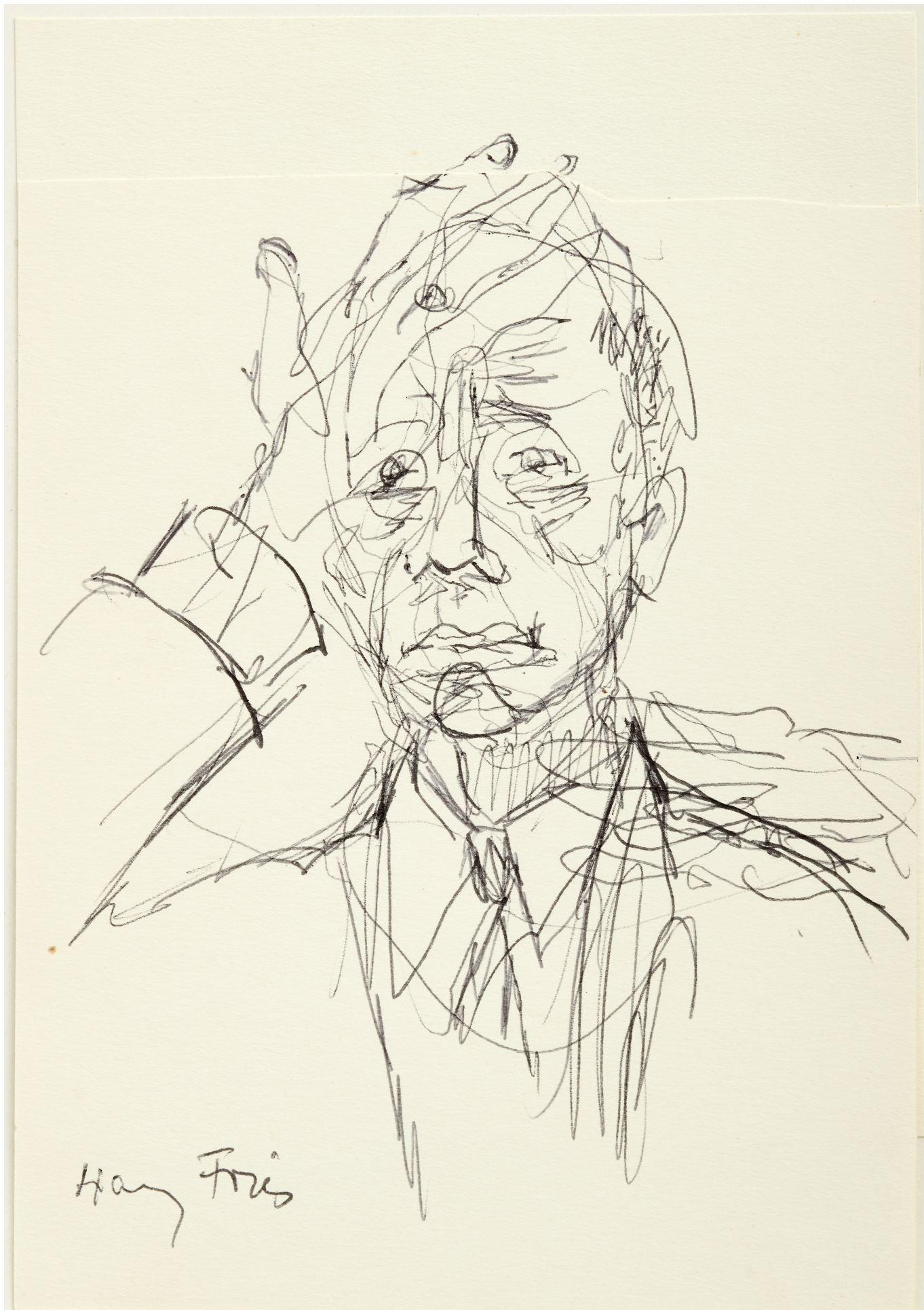
Ханни Фрайс. Джеймс Болдуин (1925-1987), 1965 г.