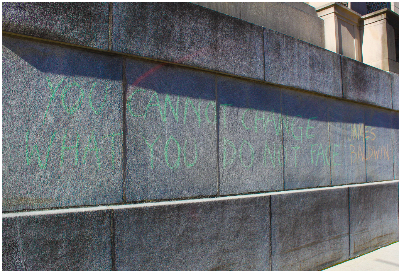
Граффити с искаженной цитатой из текста Дж. Болдуина на акции в поддержку Джорджа Флойда в Индианаполисе, 2020 г.

Если вдруг вы не знакомы с его творчеством, то знайте, что Джеймс Артур Болдуин (2 августа 1924, Гарлем, Нью-Йорк — 30 ноября 1987, Сен-Поль-де-Ванс, Франция) вырос в семье отчима-священника и был старшим из девяти детей. Своего родного отца он никогда не знал и отчасти страдал от этого, что отразилось в некоторых его произведениях. В юности Болдуин собирался пойти по стопам своего отчима, но чем старше становился, тем отчетливее понимал, что проповеди отчима расходятся с тем, что творится на улицах Гарлема и, самое главное, с его собственным поведением дома. После окончания школы в Бронксе, самом проблемном после Гарлема районе Нью-Йорка, Болдуин переехал в Гринвич-Виллидж, где началась его литературная карьера. Удивительно, но свое знакомство с мировой литературой будущий знаменитый писатель начал с Достоевского, а самым первым его опубликованным текстом стала статья о Максиме Горьком – в журнале Nation, в 1947 году.