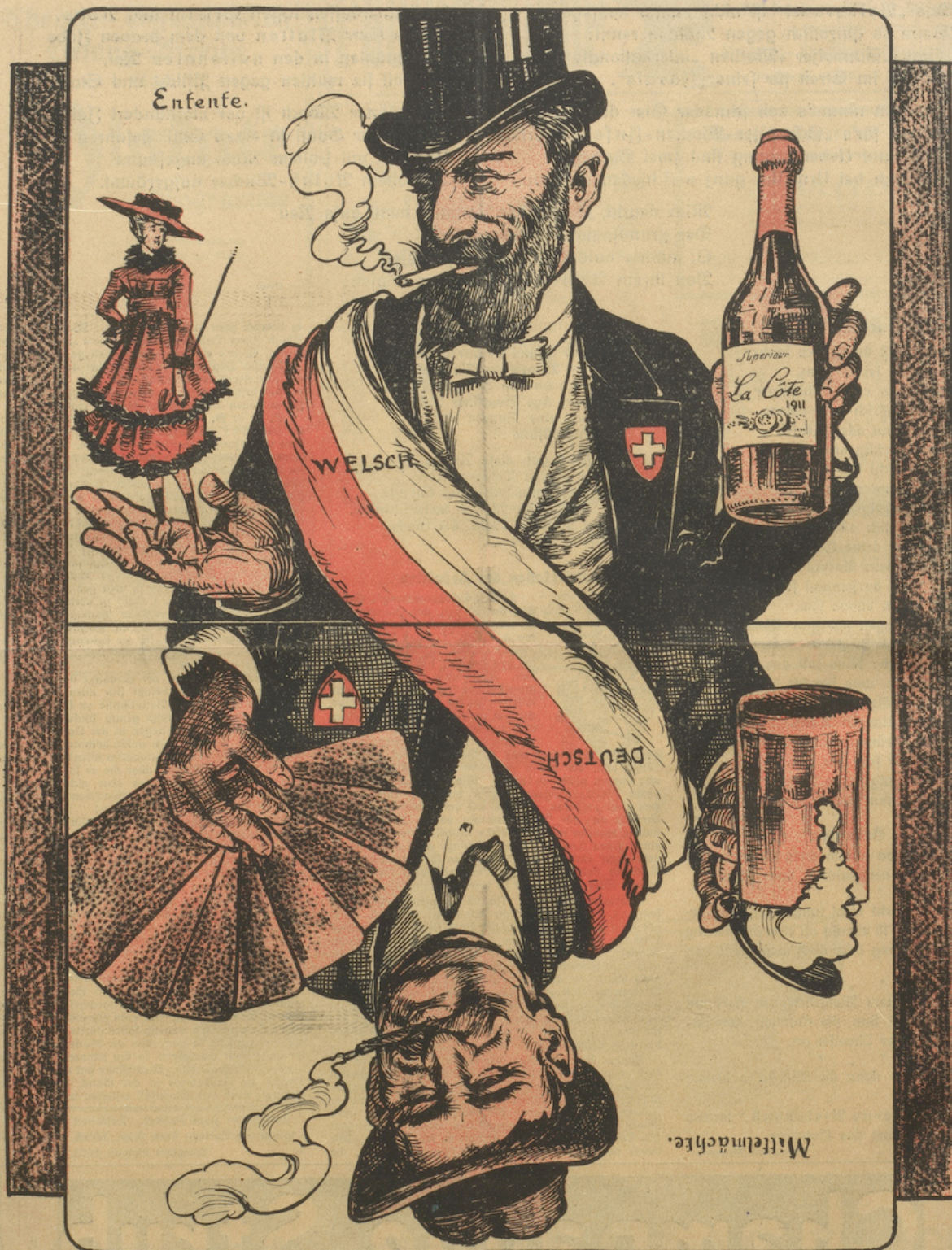
Eine symbolische Darstellung.