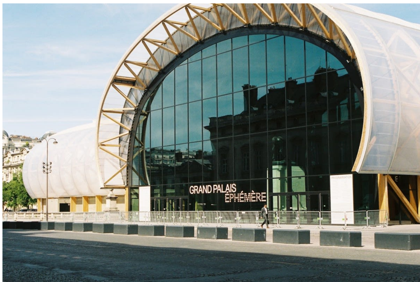
Временный Большой дворец

О том, что группа MCH, проводящая Art Basel в самом Базеле, Гонконге и Майами-Бич, откроет новую ярмарку в Париже, стало известно в январе. Новость потрясла мир искусства, так как Art Basel практически вытеснил и заменил крупнейший французский арт-салон FIAC, который в течение многих лет проводился в те же даты в октябре. Вернется ли FIAC в Париж неизвестно: некоторым аналитикам трудно представить, что город сможет вместить две таких крупных выставки. Кроме того, в Париже проходит и множество других небольших ярмарок, посвященных дизайну, современному искусству и фотографии.