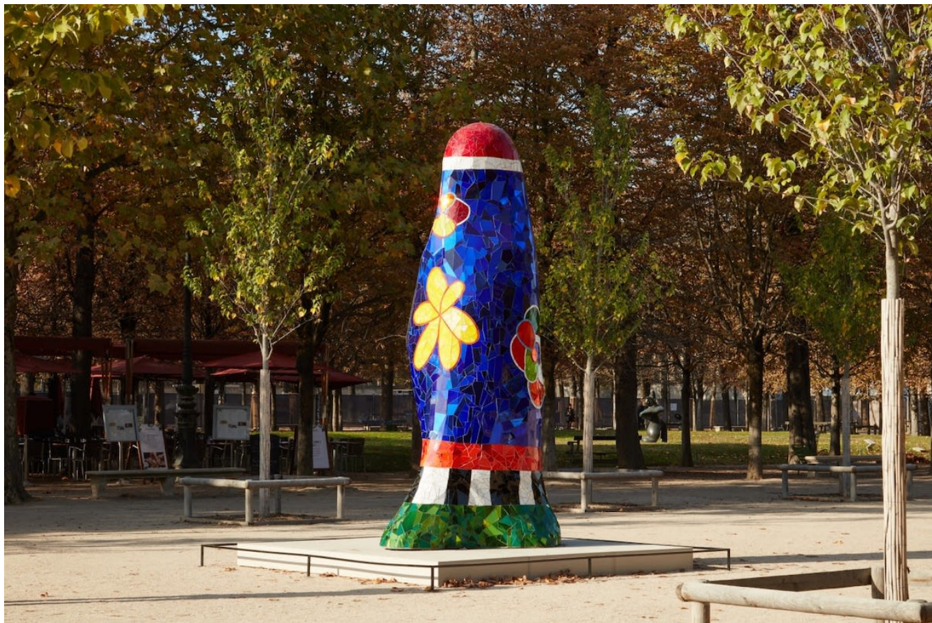
Обелиск Ники де Сен-Фалль

В Национальном музее Эжена Делакруа пройдет презентация работ афроамериканского художника Таддеуса Мосли, которая станет первой персональной музейной выставкой скульптора во Франции. Мосли представит инсталляцию, состоящую из скульптур самого разного размера – от миниатюрных до монументальных. А на Вандомской площади можно будет увидеть работу немецко-польской художницы Алисии Кваде: инсталляция из сфер и лестниц ставит под сомнение наше отношение к знанию, Вселенной и механизмам власти. «Мы должны признать абсурдность того, что мы все вместе помещены на вращающийся глобус, летающий в пустоте», - считает художница.