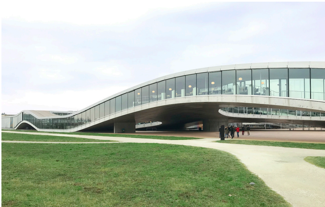
Rolex Learning Center EPFL Photo © L. Slonimsky

Author: Леонид Слонимский, Лозанна , 09.09.2022.