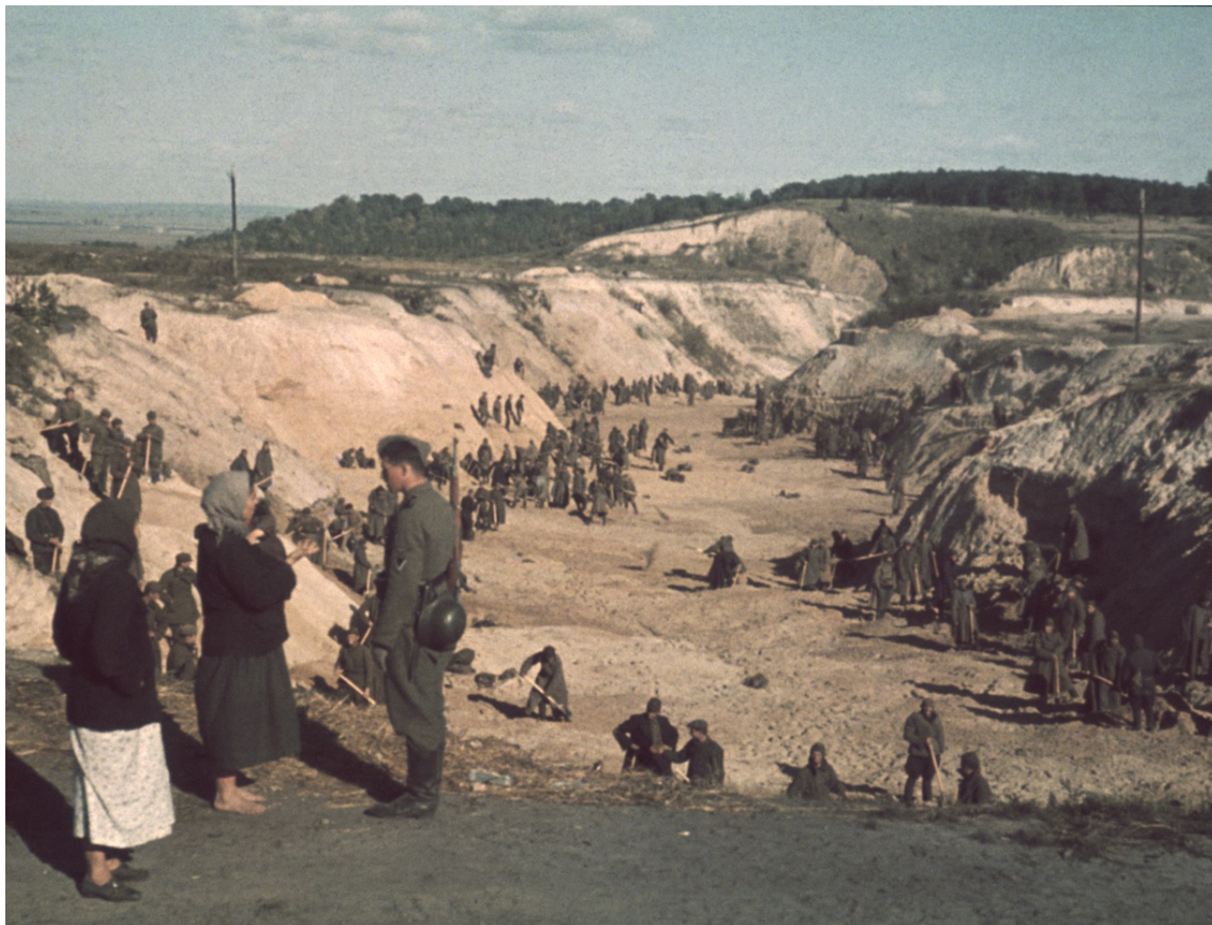
Кадр из фильма Сергея Лозницы "Бабий Яр"

виноват? Евреи! В наказание фашисты решают истребить все еврейское население города, действуя коварно: всем евреям приказано явиться на еврейское кладбище, имея с собой документы, теплые вещи и драгоценности. Они дисциплинированно пришли. Дальнейшее известно: за два дня, 29-30 сентября 1941, в Бабьем Яру был расстрелян 33 771 советский гражданин еврейской национальности. Без малейшего сопротивления остальных советских граждан и даже при содействии некоторых.