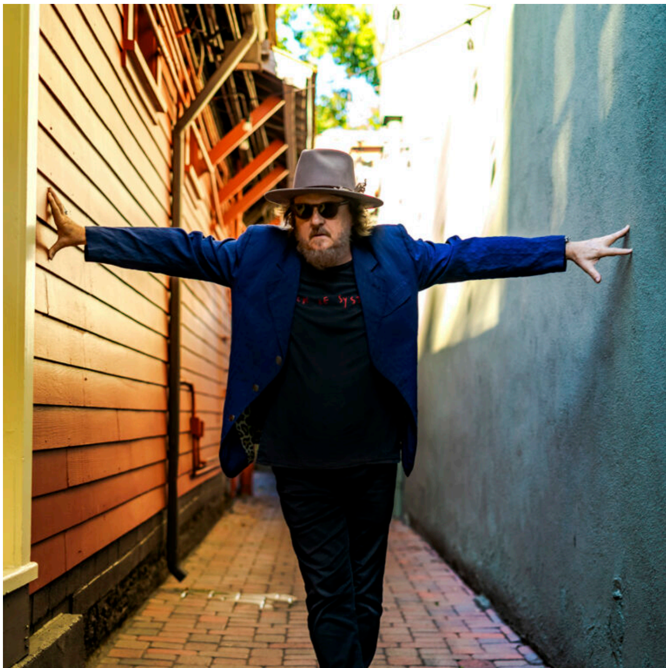
Неподражаемый Дзуккери

Напомним, что многих из включенных в программу музыкантов связывают долгие дружеские отношения с Montreux Jazz Festival. Так, именно в Монтрё в 2017 году Ибрагима Маалуфа заметил легендарный продюсер Куинси Джонс. А Дзуккери выступит на фестивале уже в четвертый раз: поклонники творчества автора хита Senza Una Donna, наверняка, помнят, как он «зажег» зал на концерте в Монтрё в 2018 году. В свои шестьдесят пять лет и с шестьюдесятью миллионами проданных альбомов, итальянец, несомненно, является одним из ведущих исполнителей блюз-рока в мире.