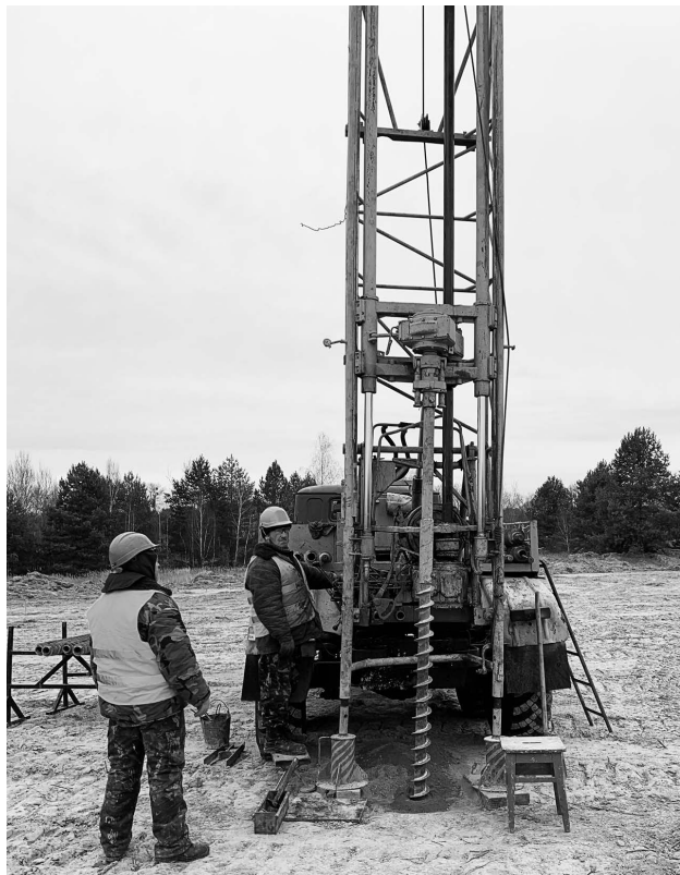
Бурение скважин для установки NSPS

В беседе с журналистом Нашей Газеты представитель швейцарской компании отметил, что полное очищение зоны отчуждения ЧАЭС в принципе возможно, однако для этого необходимо установить устройства NSPS на большей площади, в том числе вокруг энергоблоков.