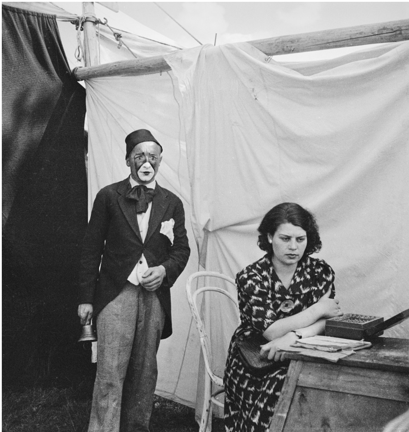
Аннемари Шварценбах. Цирк в Петсери, Эстония (сегодня – Печоры, Россия), 1937.