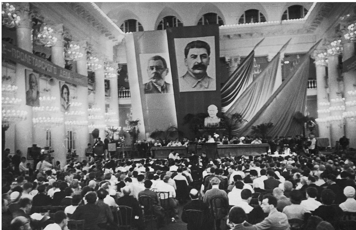
Этот снимок Аннемари Шварценбах, по-видимому, сделала на состоявшемся в 1934 году в Москве Первом съезде советских писателей.