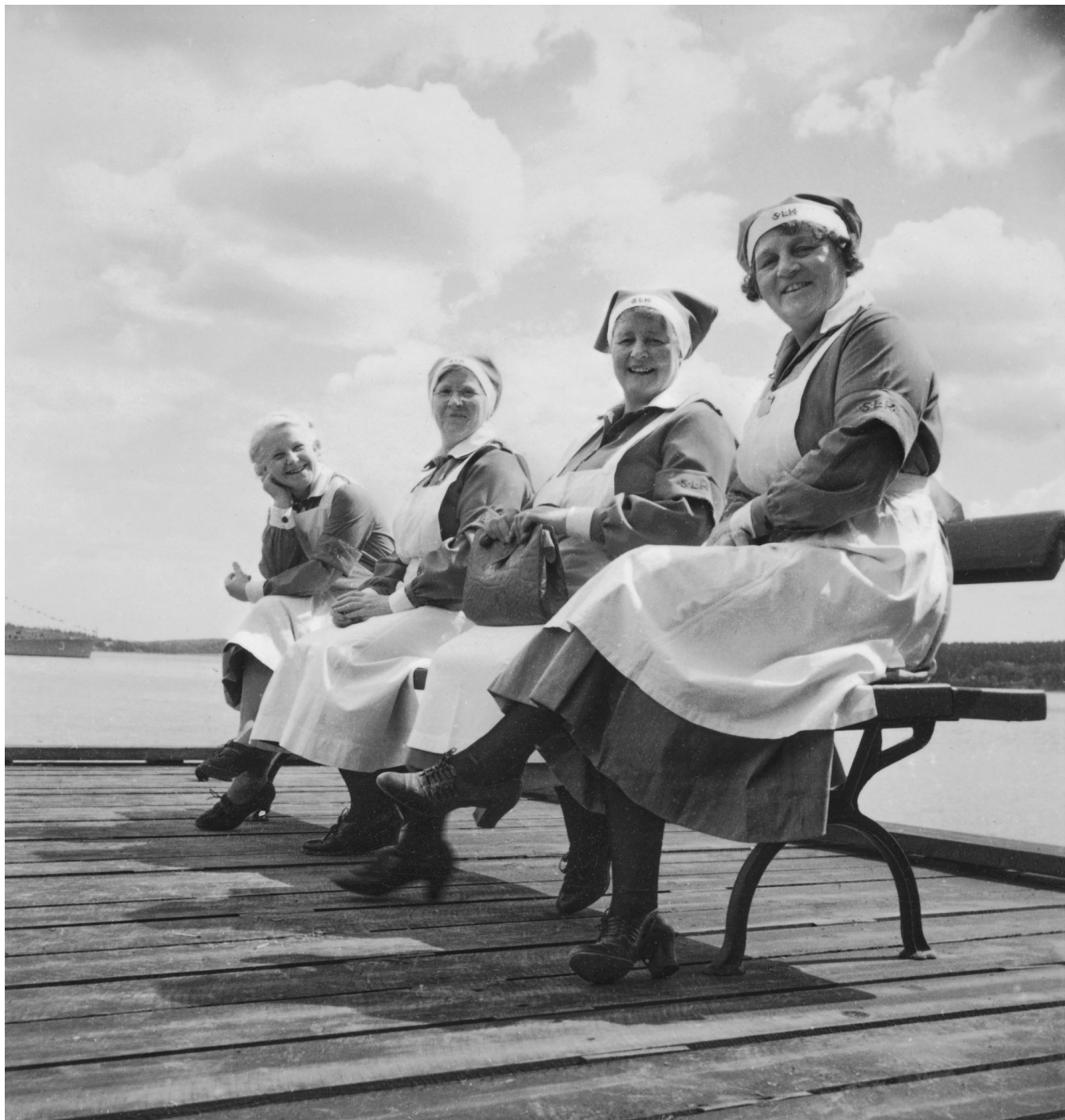
Аннемари Шварценбах. Медсестры у озера рядом с замком Грипсхолм, Марифред, Швеция, 1937.

Выставка в Центре Пауля Клее строится вокруг фоторабот, сделанных Аннемари в период с 1933 по 1942 годы во время ее поездок по Ближнему Востоку, Средней Азии, США, Европе, Центральной и Северной Африке. Многие снимки дополнены выдержками из ее текстов и писем и представляют собой ценнейшие задокументированные свидетельства разрушающегося накануне Второй мировой войны мира. От камеры Аннемари не ускользнули ни последствия экономического кризиса 1929 года в США, ни бедность, ни безработица, ни первые звоночки, свидетельствующие о наступлении фашизма, например, плакаты с изображением Гитлера и лозунгом «Один народ – один рейх – один фюрер» или национал-социалистские символы в окнах домов на улицах европейских городов.