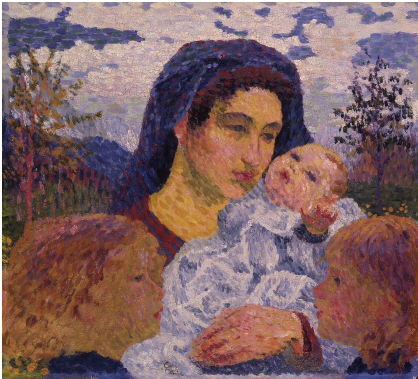
Джованни Джакометти. Мать, 1905 г.