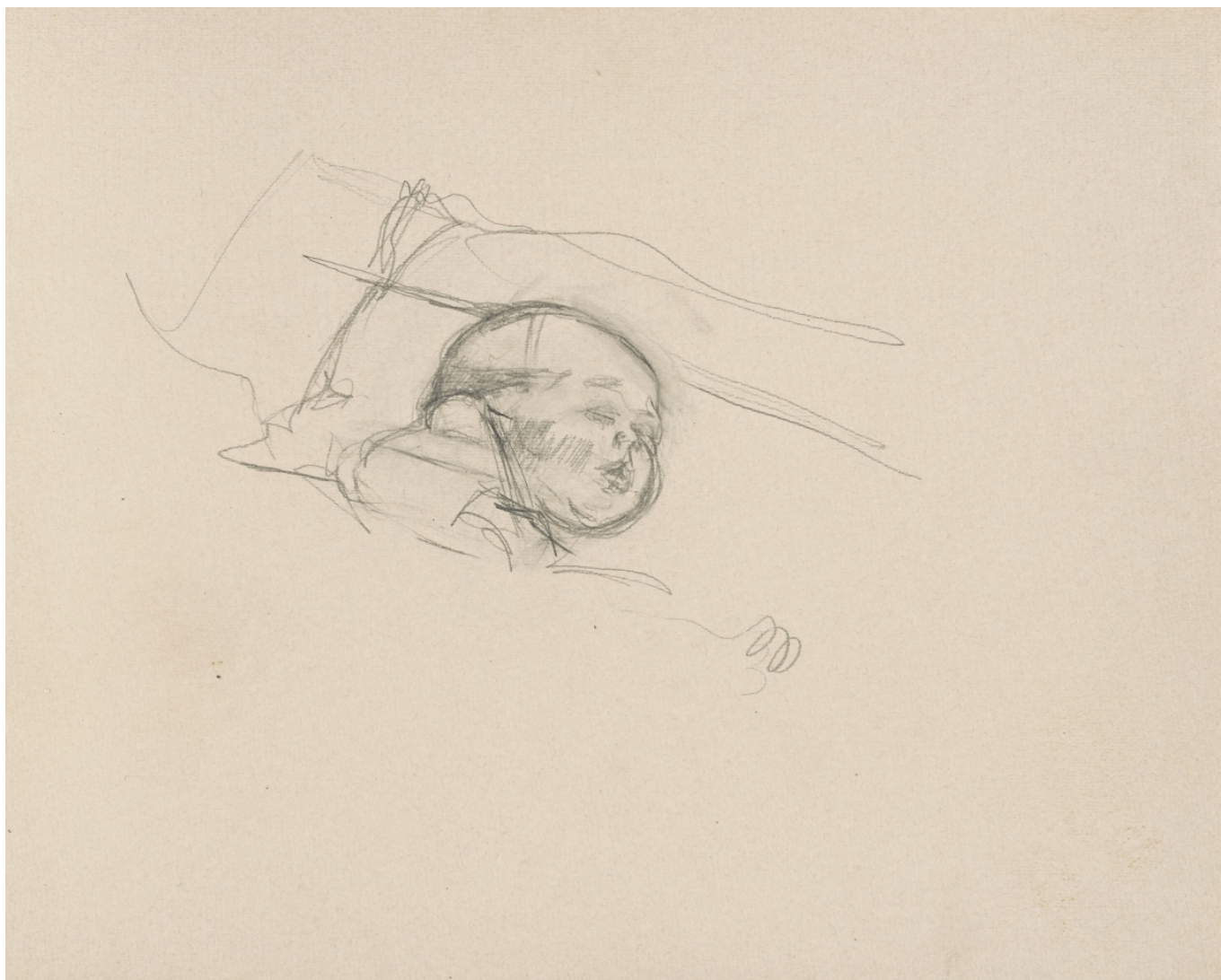
Альберто джакометти. Сильвио. Рисунки Альберто, 1937 г. © Succession Alberto Giacometti, 2000/ 2020, ProLitteris, Zurich