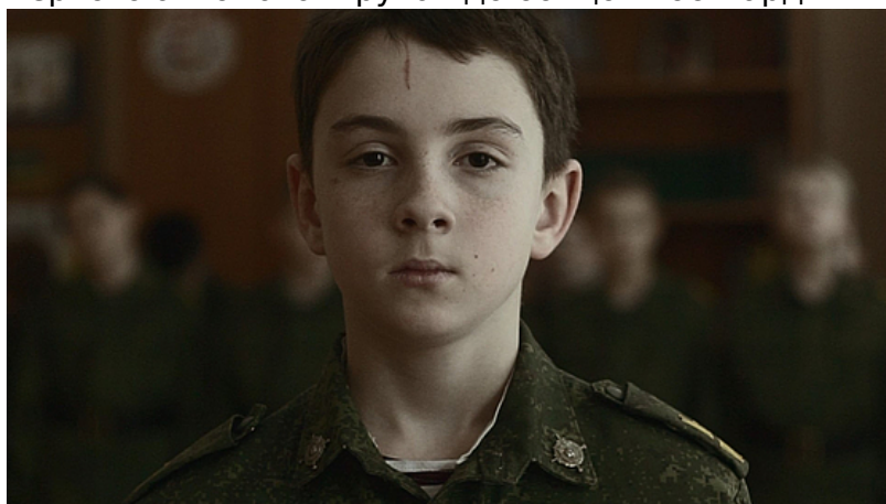
Кадр из фильма «Золотые пуговицы»