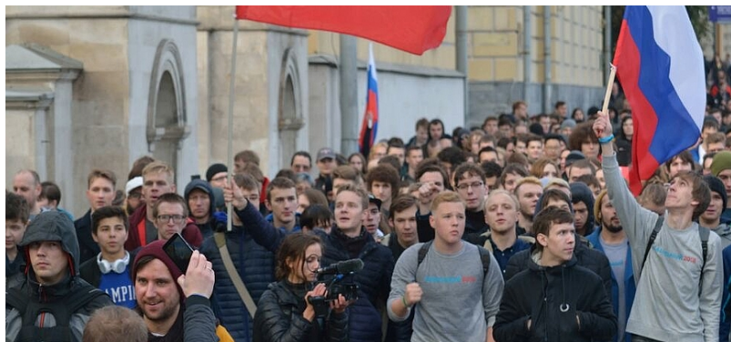
Кадр из фильма «Россия – это мы»