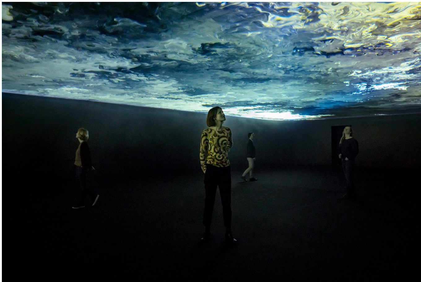
Olafur Eliasson, Symbiotic seeing, 2020. Vue d'installation: Kunsthaus Zürich, 2020.

23 января и 6 февраля в Кунстхаусе состоятся вечера «Black Out». Музей будет работать до 23 часов, при этом электрическое освещение будет отключено, а посетители смогут осмотреть часть музейной коллекции в темноте с эко-лампами в руках. Эти лампы, имеющие форму цветов и работающие на солнечных батареях, были разработаны Элиассоном в рамках проекта Little Sun (англ.: маленькое солнце) специально для людей, которые проживают в регионах, лишенных электричества или испытывающих перебои с электроснабжением. Часть вырученных средств пойдет на финансирование инициативы Little Sun.