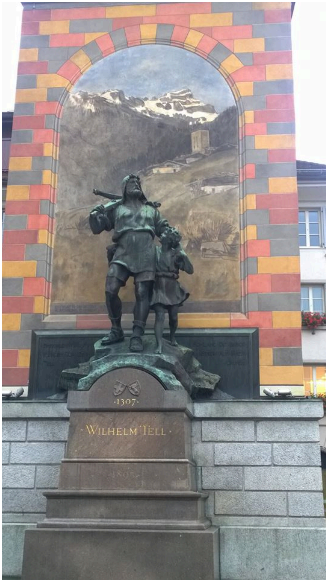
Чей символ - бык