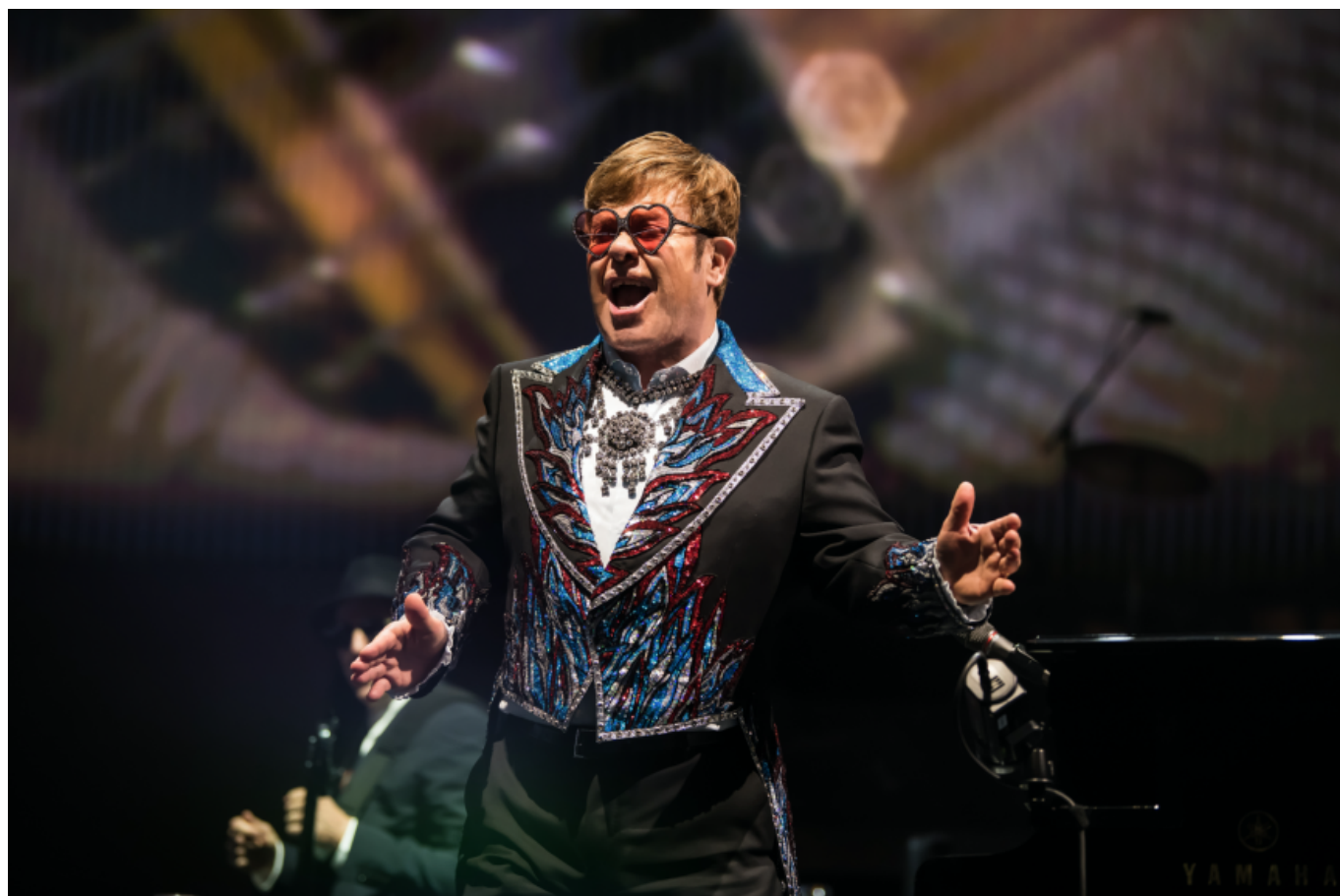
Элтон Джон - легенда музыки и икона стиля.