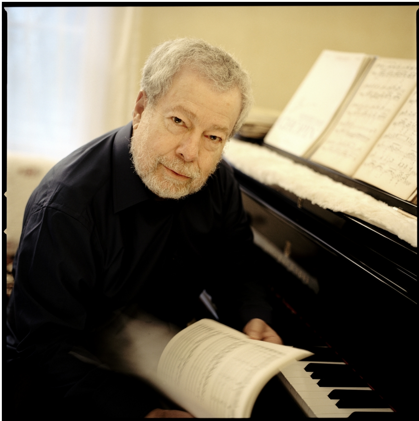
Нельсон Фрейре

За пульт Оркестра Романдской Швейцарии встанет в этот вечер 82-летний израильский дирижер Элиаху Инбал. Начав профессиональное образование в Израильской академии музыки как скрипач, он продолжил его, по рекомендации Леонарда Бернштейна, в Парижской консерватории уже как дирижер и в 1963 году выиграл в Италии Конкурс дирижеров имени Гвидо Кантелли.