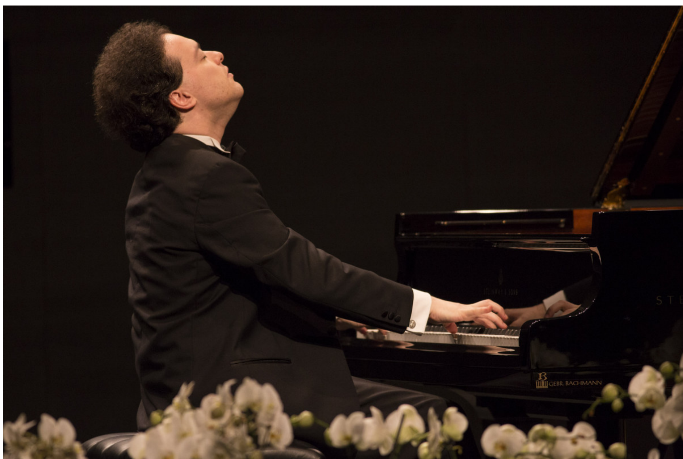
Играет Евгений Кисин