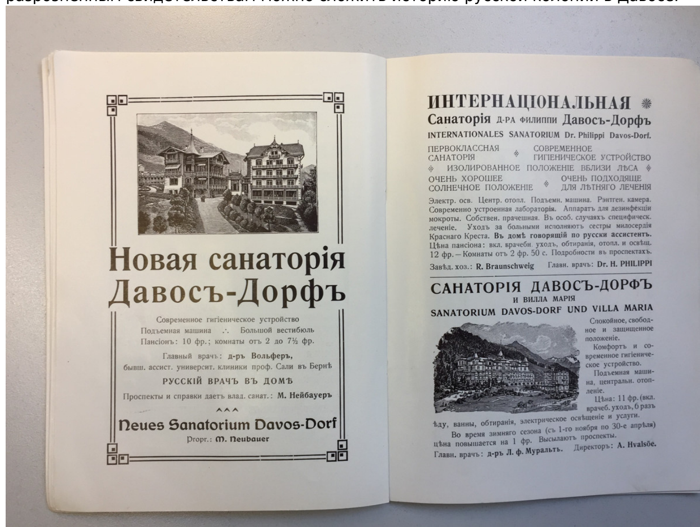
Иллюстрация из книги "Путеводитель по Давосу" (Давос, 1911)

Уникальная особенность давосской коллекции – это штампы на большинстве книг коллекции на русском, французском, немецком языках, разные по форме (овальные, круглые, одной строкой). Их можно условно разделить на две группы. Первая – штампы русского культурного общества в Давосе: «Русская библиотека в Давосе – Suiss Canton des Grisons – Bibliothèque Russe à Davos», «Русское общество в Давосе – Cercle Russe de Davos», «Библиотека русского общества имени Л.Н. Толстого – Bibliothèque Russe de Davos», «Eigentum Bibliothèque Russe de Davos». Вторая – штампы самих давосских санаториев, очевидно, тех, где находились пациенты из Российской империи: «Русская народная санатория», «Russisches Sanatorium für minderbemittelte Lungenkranke in Davos (Dorf)» (рус. «Русский санаторий для нуждающихся легочных больных в Давосе-Деревне»), «Eigentum d. Sanatorium Valbella» (рус. «Собственность санатория Вальбелла»), «Internationales Sanatorium Davos-Dorf» (рус. «Международный санаторий Давос-Деревня»). По всем этим разрозненным свидетельствам можно сложить историю русской колонии в Давосе.