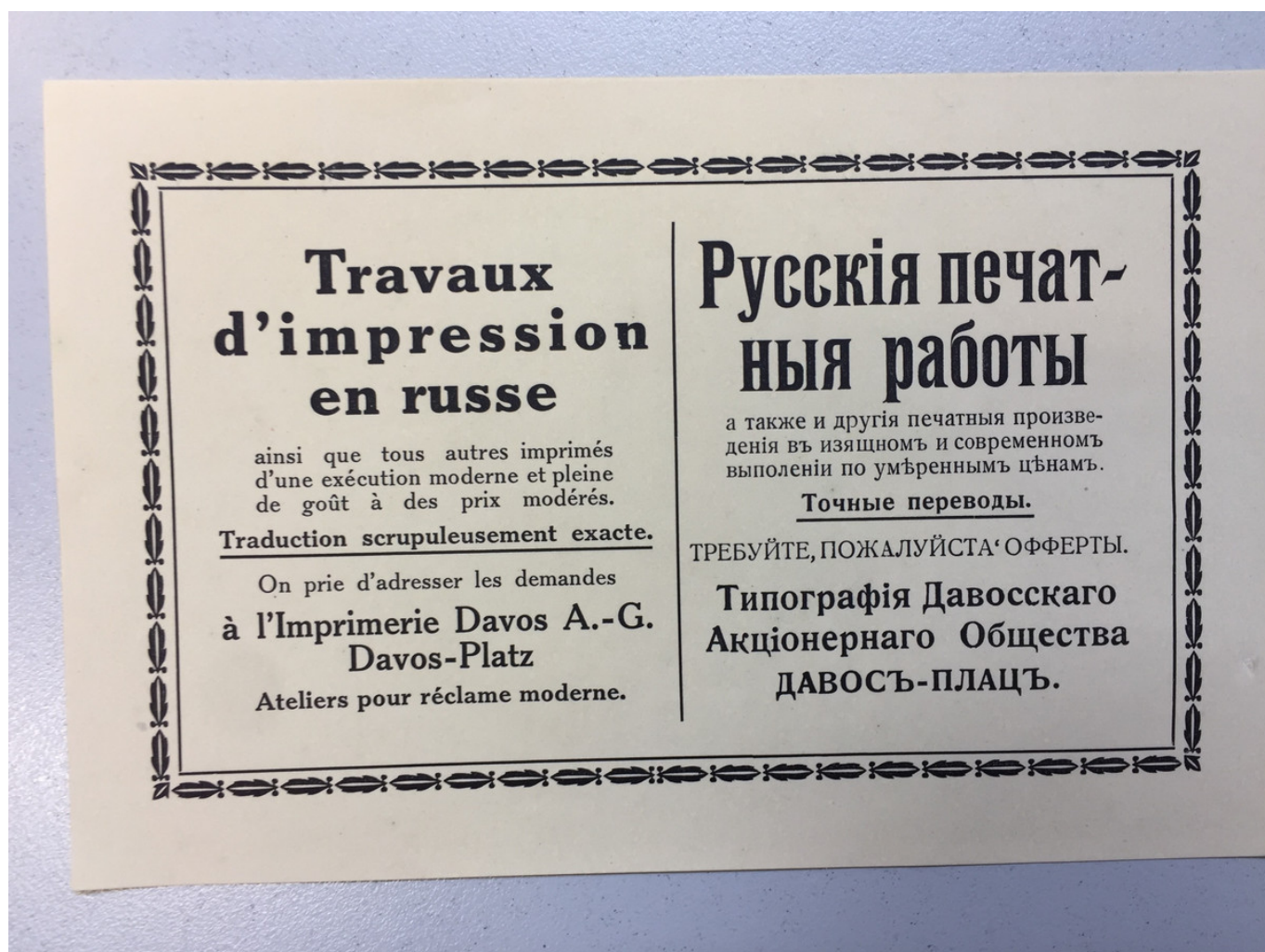
Рекламный листок Давосской типографии (примерно 1910-1912 гг.)

периодические сборники. В коллекции хранятся подшивки журналов «Нева», «Мир Божий», «Образование», «Вестник Европы», «Вестник иностранной литературы», «Жизнь», «Современные записки», «Дело». Есть литературные альманахи – «Сполохи», «Белые Ночи», «Аполлон», «Союз», «Литературно-художественный альманах издательства Прибой» и другие. Большой корпус составляют анонимные революционные брошюры того времени, например, «Социализация земли» (Одесса, 1906), «Царское правительство и рабочий народ» (Лондон, 1902). В Давосе с 1902 г. действовало и свое русское издательство, совмещенное с типографией. Название давосского издательства стоит на титульном листе на русском или на немецком языке, часто варьируется, например: «Издание акционерного общества давосской типографии», «Типография Давосскаго Акционернаго Общества», «Davoser russische Nachrichten» (рус. «Давосские русские новости»). В Давосе выходили и собственные периодические издания на русском языке: «За рубежом», «Давосский вестник», книжная серия «Свободная библиотека» (в некоторых вариантах – «Русская свободная библиотека»), а также книги другой тематики, например, «Путеводитель по Давосу» (Давос, 1911). Революция 1905 г. докатилась и до Давоса, здесь также начали печатать литературу пропагандистского характера, например, политическую сатиру «Царь Николай II, его среда и советники» (Давос, 1905).