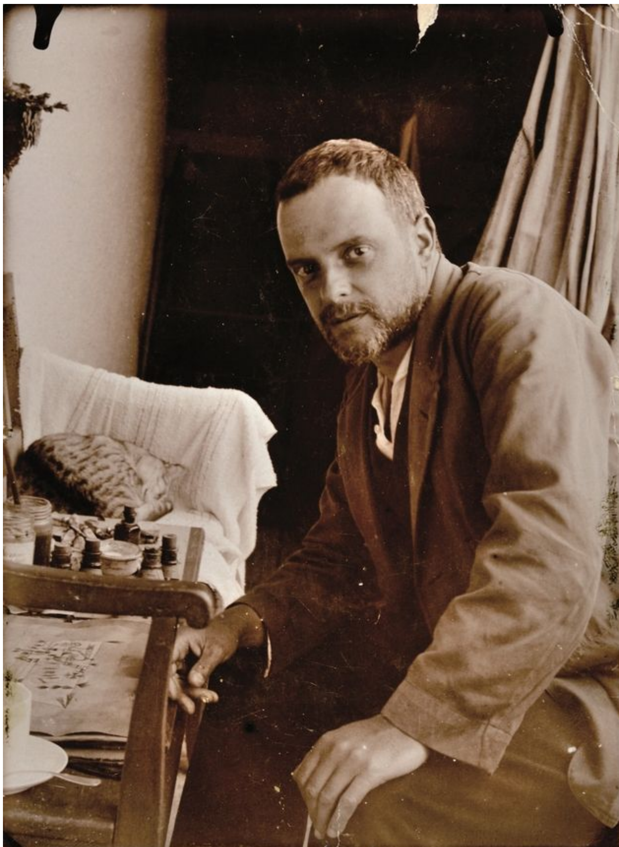
Пауль Клее и его кот Фрипуй.

Глупо? Несерьезно? Не спешите обвинять Клее в легкомысленности, лучше обратите внимание на дату. 1933 год. К власти в Германии пришли нацисты, и Клее уволен с поста преподавателя Академии искусств в Дюссельдорфе. Он пока не знает, что совсем скоро его картины будут объявлены «дегенеративным искусством», т.е. не отвечающим эстетическим представлениям Третьего Рейха, но он уже что-то