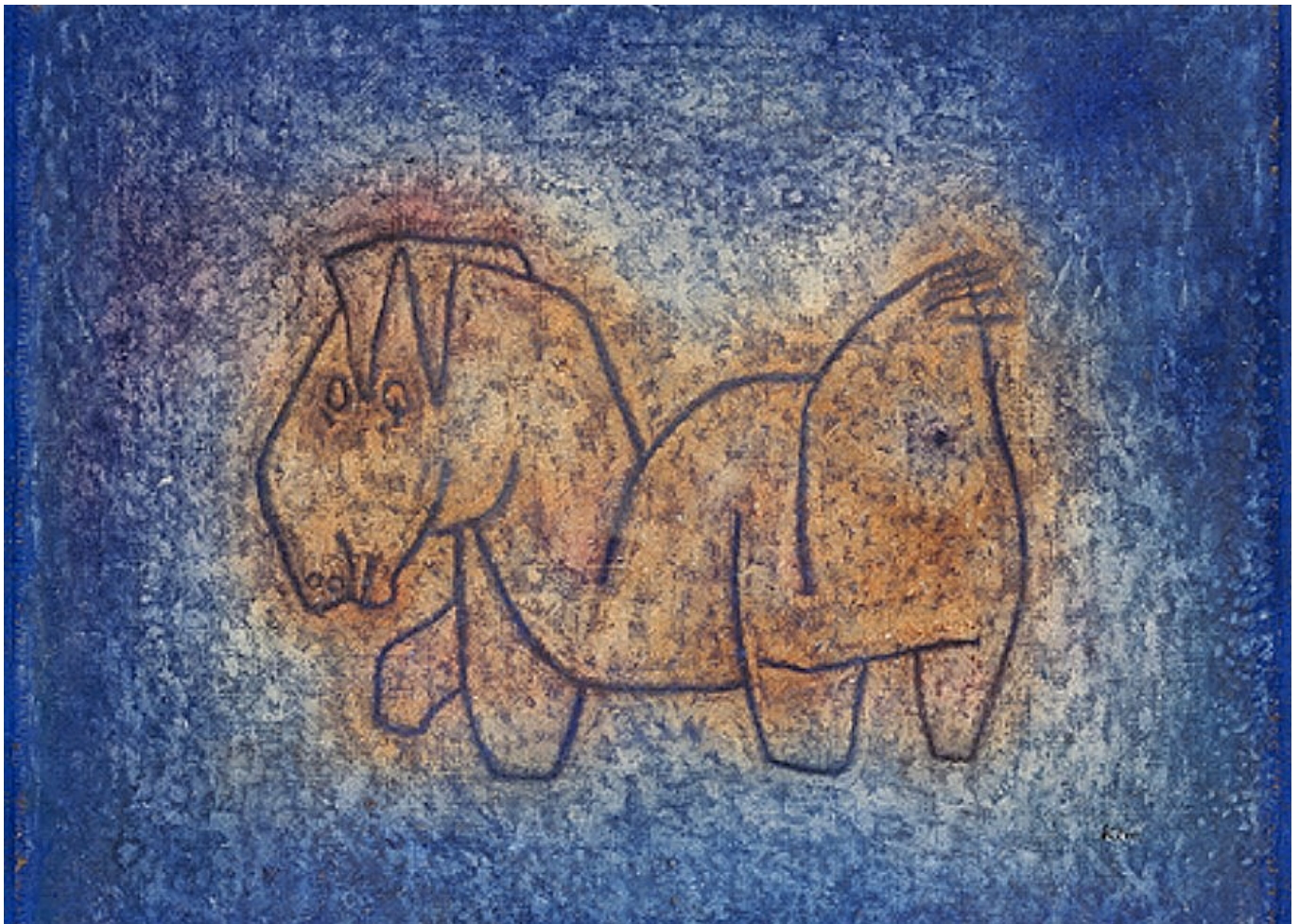
Paul Klee, Bastard, 1939

Author: Заррина Салимова, Берн , 26.10.2018.