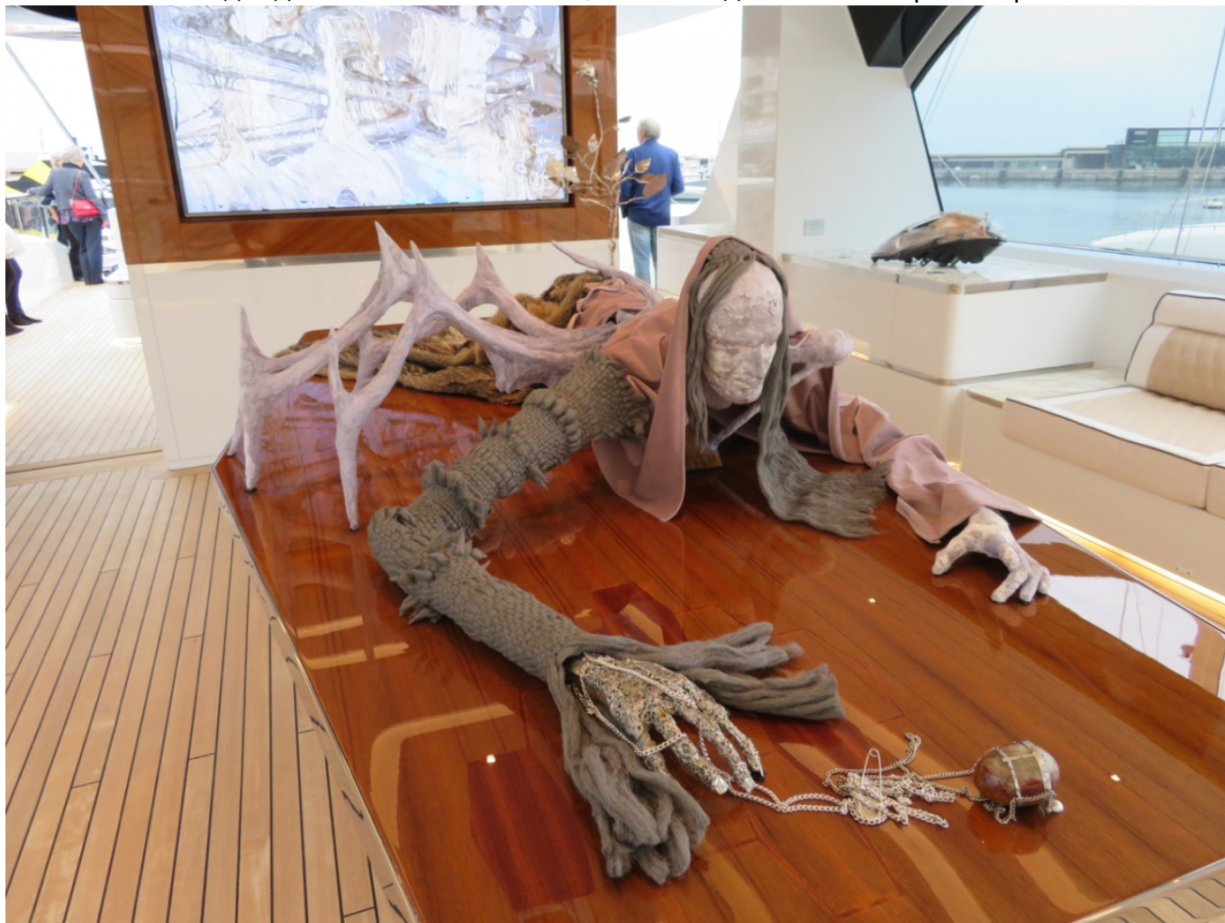
Фрагмент экспозиции Hypersea, размещенной на яхте Jetsetter

групповой выставке Hypersea, увидеть которую VIP-гости могли на частной яхте, пришвартованной в порту Монако. Таким талантом обладают единицы, остальные же материально обеспеченные любители в основном «примеряют» выставленные на продажу предметы к своим гостиним, размышляя, долго ли они будут радовать их глаза. Такой подход нам вполне понятен, хотя мы для себя не присмотрели ничего.