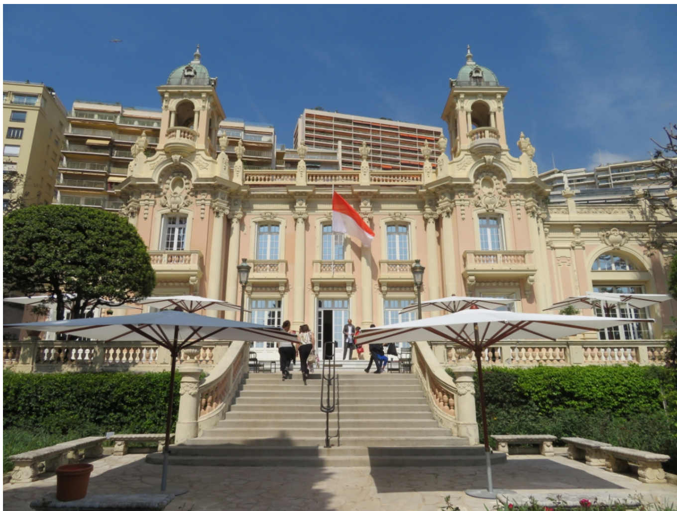
Национальный музей Монако - партнер выставки