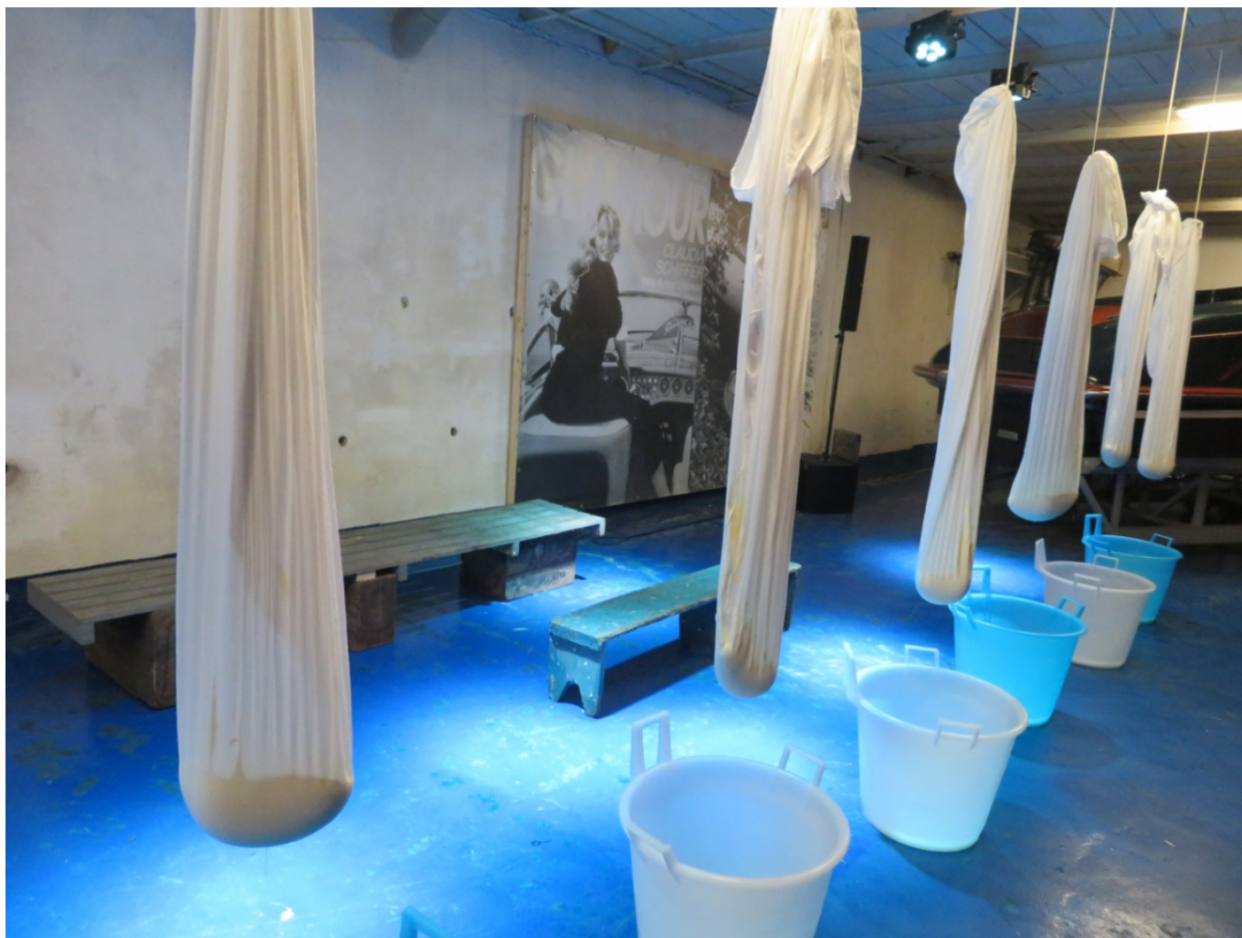
Моцарелла в зачатке как произведение искусства