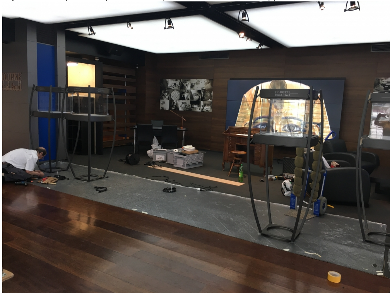
Павильон F. P. Journe создавался на наших глазах

располагающем к получению удовольствия месте. Помимо возможности посетить за один день 45 галерей (а именно столько приехало в этом году в Монте-Карло), особо отличившимся коллекционерам предоставляется возможность участия в ВИП-программе, предполагающей знакомство с частными коллекциями, в остальное время сокрытыми от посторонних глаз. Благодаря партнерским отношениям с организаторами и с одним из главных спонсоров – швейцарским часовым брендом F. P. Journe, автор этих строк смогла присоединиться к этой группе.