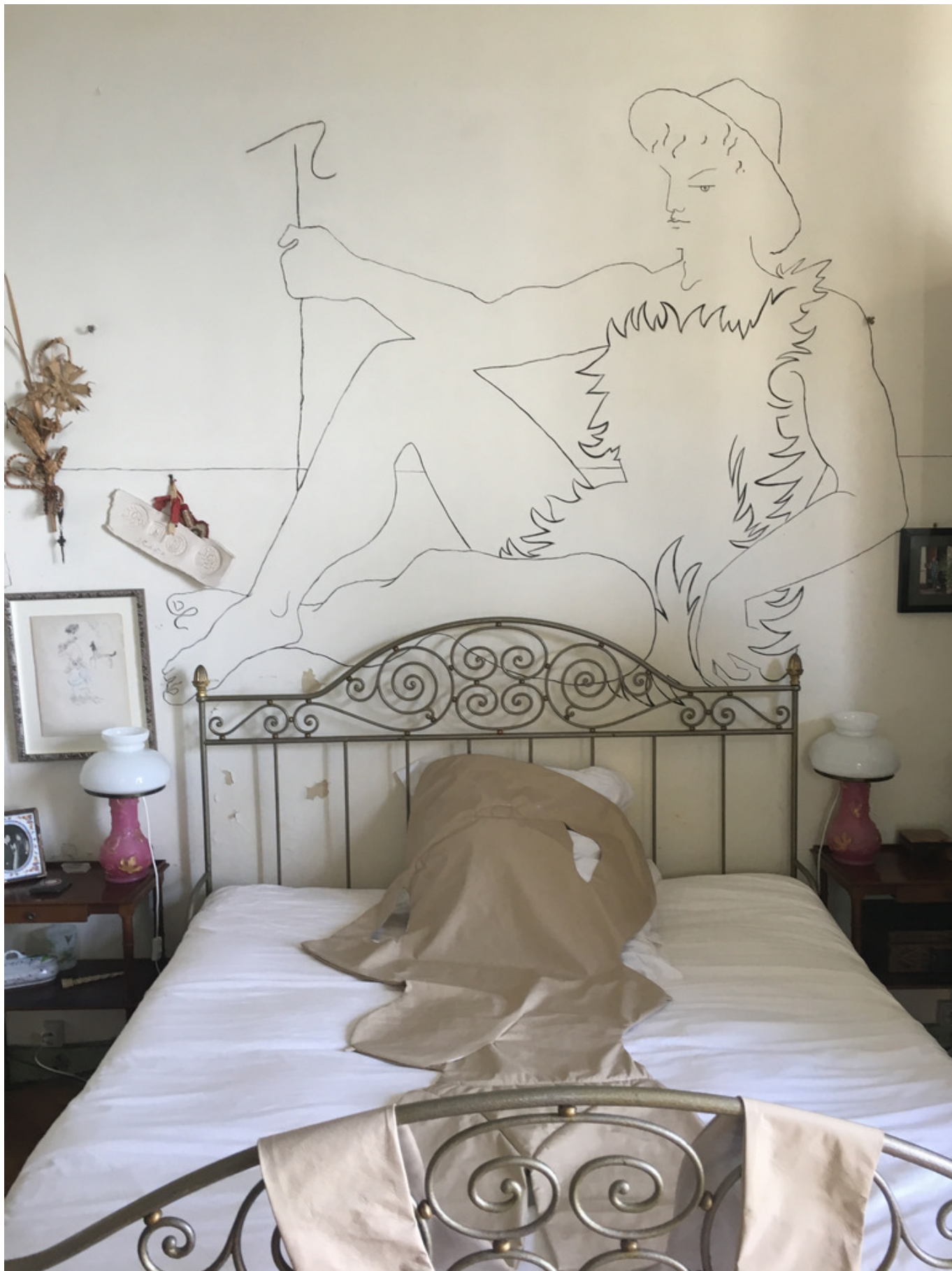
Одна из спален виллы Santo Sospir

«Делегацию artmont-carlo» принимал владелец виллы, приветствовавший гостей на