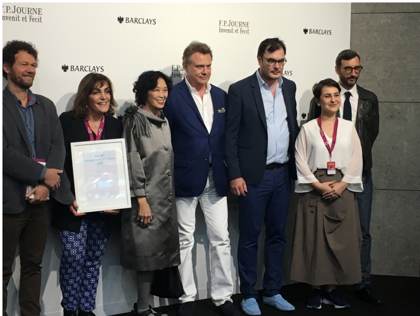
Премия Prix F. P. Journe вручена!