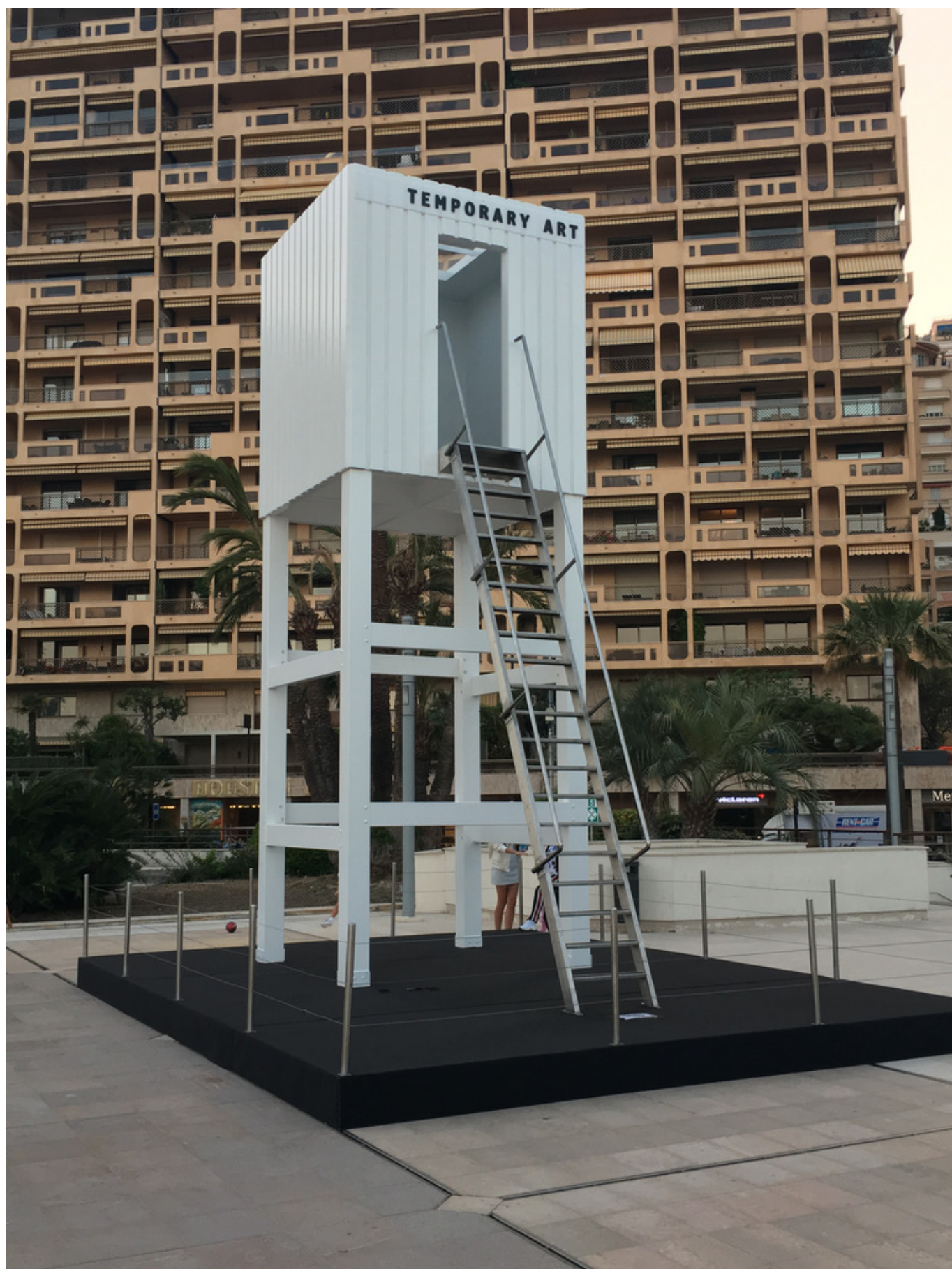
Temporary art - памятник преходящему искусству? (Nashagazeta.ch)

Если совсем коротко, то цель ярмарки – свести продавцов и покупателей в приятном,