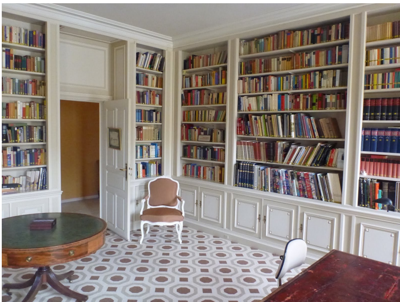
Библиотека Замка Лавиньи

Author: Анна Матвеева, Лавиньи , 11.08.2016.