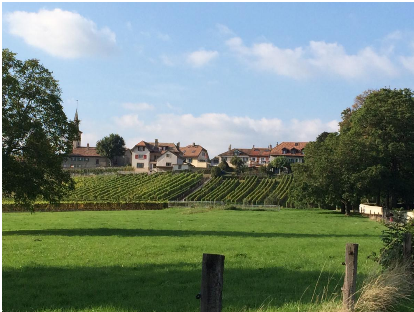
Окрестности замка Лавиньи