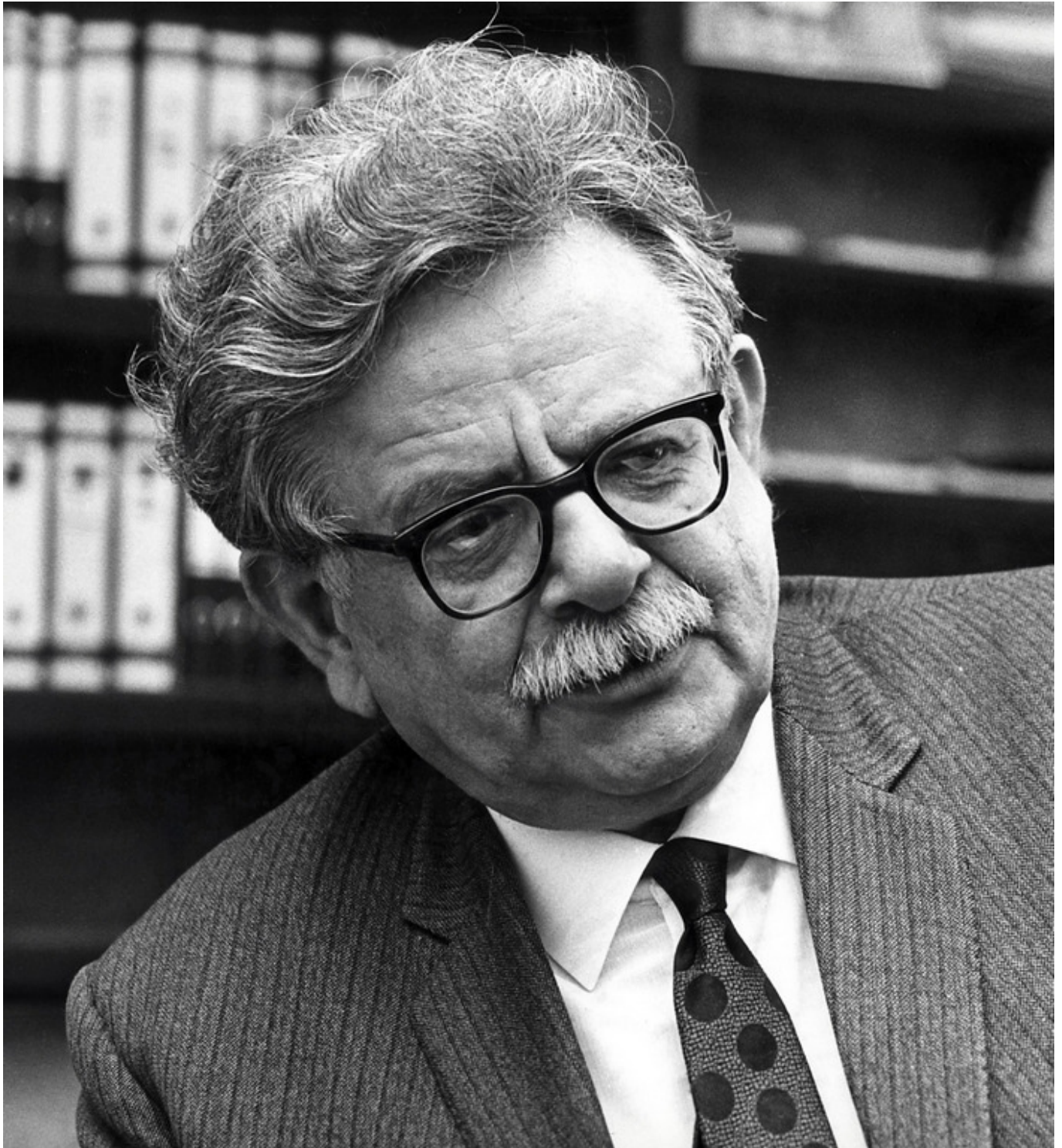
Элиас Канетти (1905 - 1995)

одного интервью, даже после получения Нобелевки!